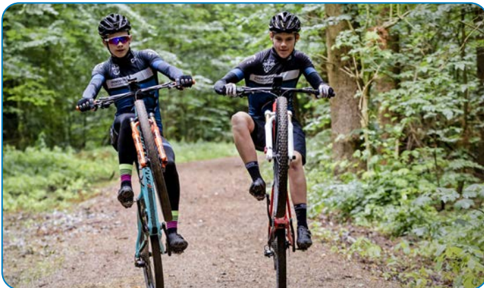
Venskaber opstår gennem et aktivt udeliv.