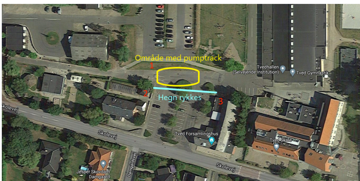
Billede 3 - Forslag til pumptrack placering.

Pumptrackens præcise størrelse er en professionel vurdering, men uanset hvad, vil den kunne være indenfor det rykkede hegn og placeret mellem skråningen med græs 1 , den lille sløjde-hytte 2 og for enden af Tved Forsamlingshus 3 , se billede 3.