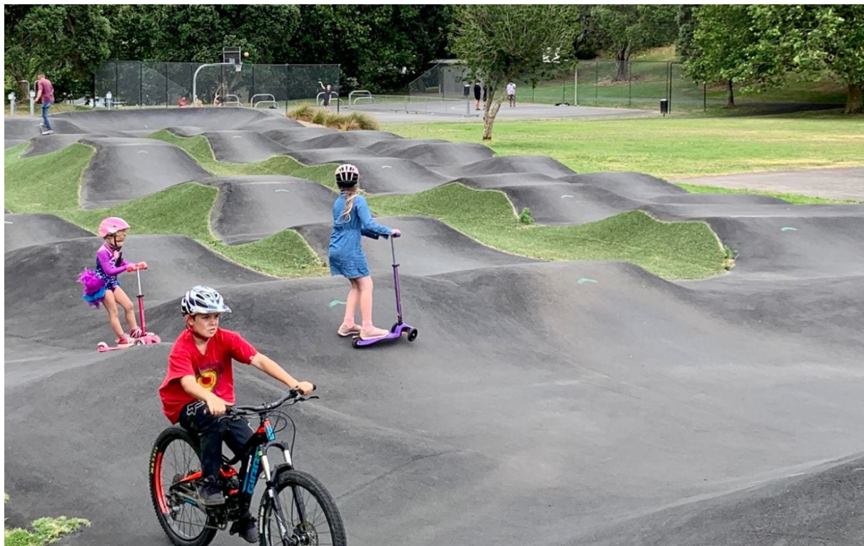
Billede 1 - Et eksempel på pumptrack

Ad 1. Pumptracks kan have meget forskellige udformninger, vi tænker noget i denne retning: