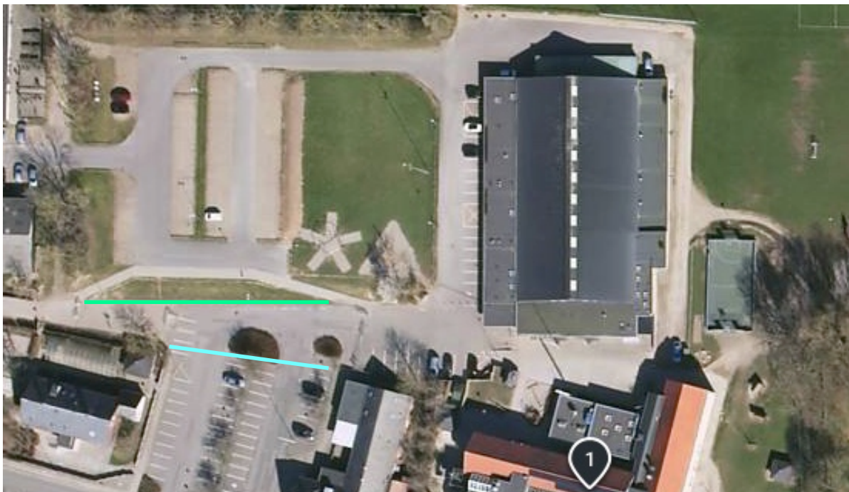
Billede 2 - FØR: Nuværende hegn med grønt, EFTER: Rykket hegn med blåt.

blive en naturlig del af pumptracken og lyse op, når det bliver mørkt, så tracken også kan bruges om aftenen.