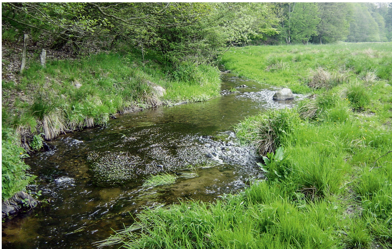
De små ørredbække har stor værdi for samfundet. Produktionen af havørredyngel i en god ørredbæk skaber en årlig omsætning ved lystfiskeri efter havørred et sted i Danmark på mindst 283.000 kr pr. km gydevandløb.

højt (Hasler et al. 2016) – men indtil videre er der ikke beregnet andre referencetal for værdien af det danske havørredfiskeri.