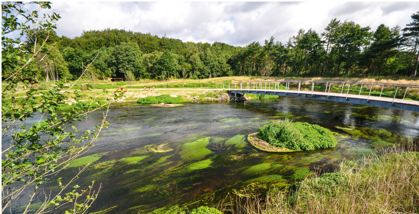
De store vandløb er også værdifulde. Dette stryg i Vejle Å producerer årligt flere hundrede ørredsmolt.

Dvs. at selv uden at medregne medfinansiering fra EU er der en stor gevinst for samfundet ved en miljøindsats i ørredens gydevandløb, hvis en del af den øgede ørredbestand bliver fanget som havørreder af lystfiskere.