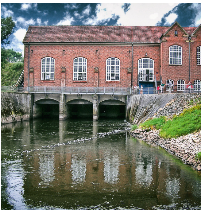
Det gennemsnitlige smolttab ved vandkraftværker er så højt som 82 %.