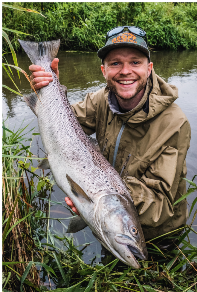
Værdien af en lystfiskerfanget havørred, som tages med hjem, vurderes at ligge mellem 1.000 kr og 2.500 kr per kg.