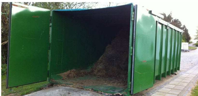
Eksempel på tæt container til opbevaring af fast husdyrgødning

Der skal benyttes en tæt og bestandig container, der opfylder kravene i landbrugets byggeblad nr. 103.06-08. Det vil sige, at containeren skal være væsketæt, overdækket og placeret på et stabilt underlag. Containeren skal placeres med hældning væk fra åbningen, og den skal tømmes efter behov til et andet lovligt opbevaringssted.