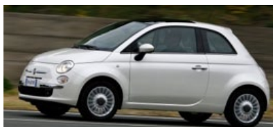
Fiat 500 Den nuttede retrobil vandt i 2007 vandt kundernes hjerter. Er desuden kåret som Car of the Year 2008.

År 2001 - Terrorangrebet på World Trade Center i New York og Pentagon i Washington DC.