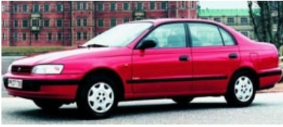
Her en Toyota Carina, som var den mest solgte bil i Danmark i 1994.