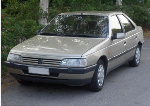
I 1988 blev Peugeot 405 kåret til årets bil i Danmark.