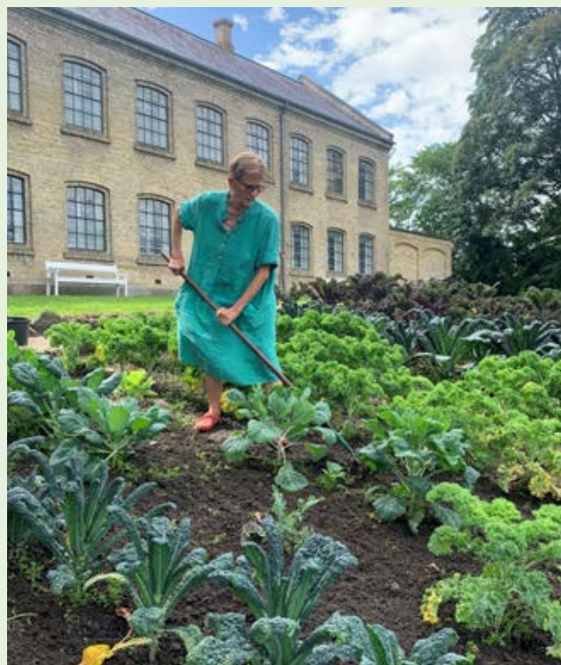
Fattiggårdens have stod smukt igen i år i kraft af de frivilliges fantastiske og uvurderlige indsats.

Gennem året blev der desuden gennemført en række interviews med tidligere anbragte indenfor forsorgens forskellige grene, som led i museets fortsatte indsats for at sikre indsamlingen af disse vigtige vidnesbyrd.