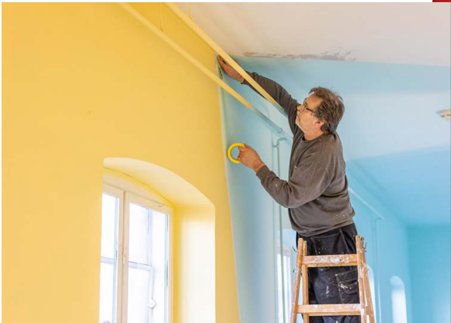
Teknisk Afdeling brugte en stor del af vinteren på at klargøre og male rummene til den nye udstilling "ANBRAGT".