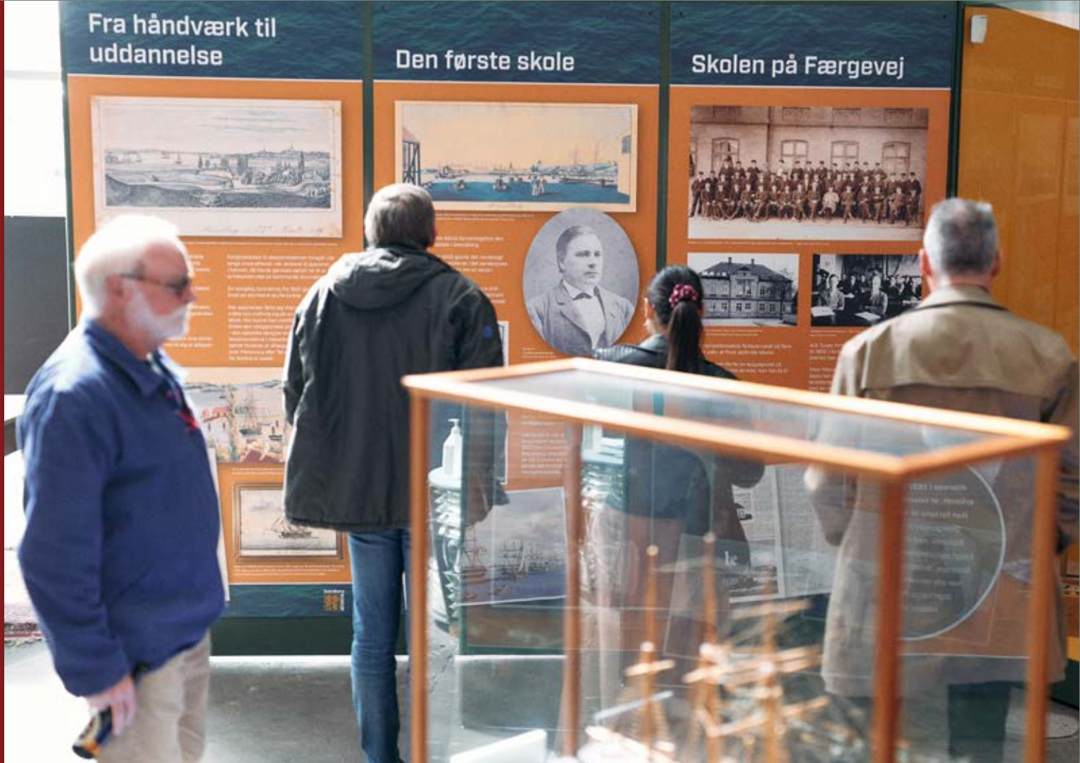
Udstillingen "På rette vej" i lokalerne på Frederikshavn fortalte om navigationsskolerne fra dengang søfolkene sejlede på en-mastede træskibe og til i dag, hvor de sejler på containerskibe, der er så store, at de kan transportere det samme som 2.000 skonnerter.