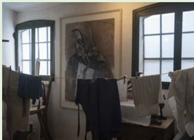
Et af kunstner Ole Lejbachs stærke portrætter i samspil med Fattiggårdens vaskerum.

I august blev et formidlings samarbejde med unge fra Ringes Kost- og Realskole igangsat. Skolens elever er anbragt uden for hjemmet, og i det eksperimentelle formidlingsprojekt samarbejder de med museet om at udvikle formidling, hvor det er deres historier og perspektiver, der er i centrum. Samarbejdet fortsætter i det kommende år, og til februar 2024 åbner de unge deres første særudstilling på museet.