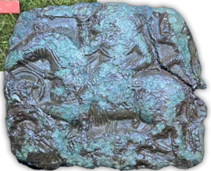
På patricen ses motivet med rytteren til hest.

Et af de ulovlige gravede huller på Ørkild. I græsset ved siden af blev der fundet et sammenfoldet stykke bly, som sandsynligvis var det, som havde givet udslaget på metaldetektoren.