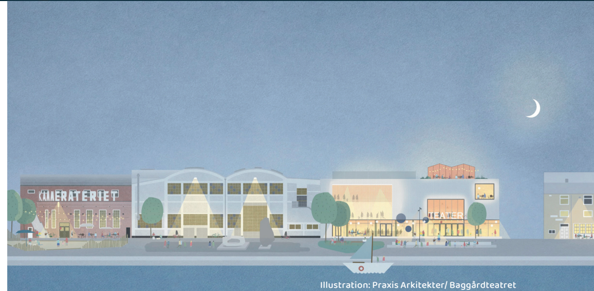
Illustration: Praxis Arkitekter/ Baggårdteatret