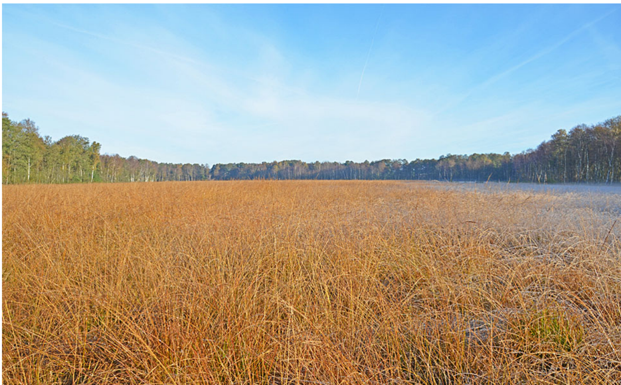
Højmosen Nybo Mose er under tilgroning med blåtop grundet uhensigtsmæssig hydrologi.

Indsatserne har dog kun omfattet mindre dele af de arealer der tidligere har været drænet. Der er derfor et fortsat behov for at genskabe mere optimal hydrologi i området.