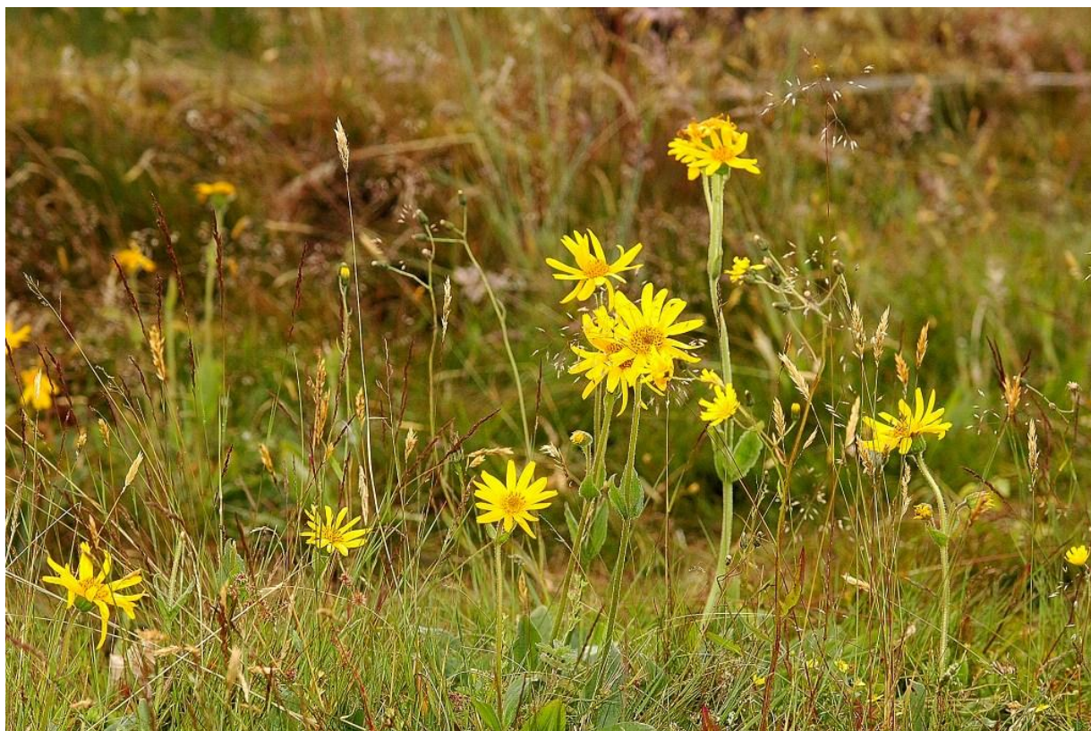
Guldblomme vokser på næringsfattige sure overdrev. Den findes i Svinehaverne som det eneste sted i den østlige del af Danmark.