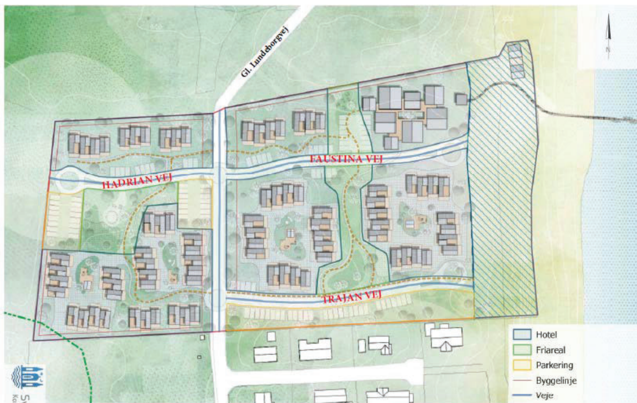
Forslag til nye vejnavne ved Lundeberg Badehotel – Hadrian Vej, Faustina Vej og Trajan Vej.