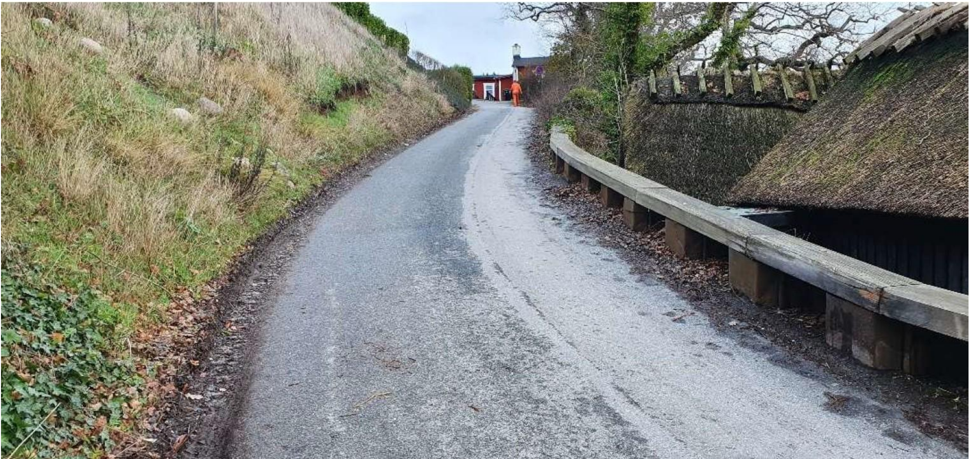
Gambøtvej med begrænsning mod syd af eksisterende spuns og bevaringsværdige fiske- og redskabshytter.