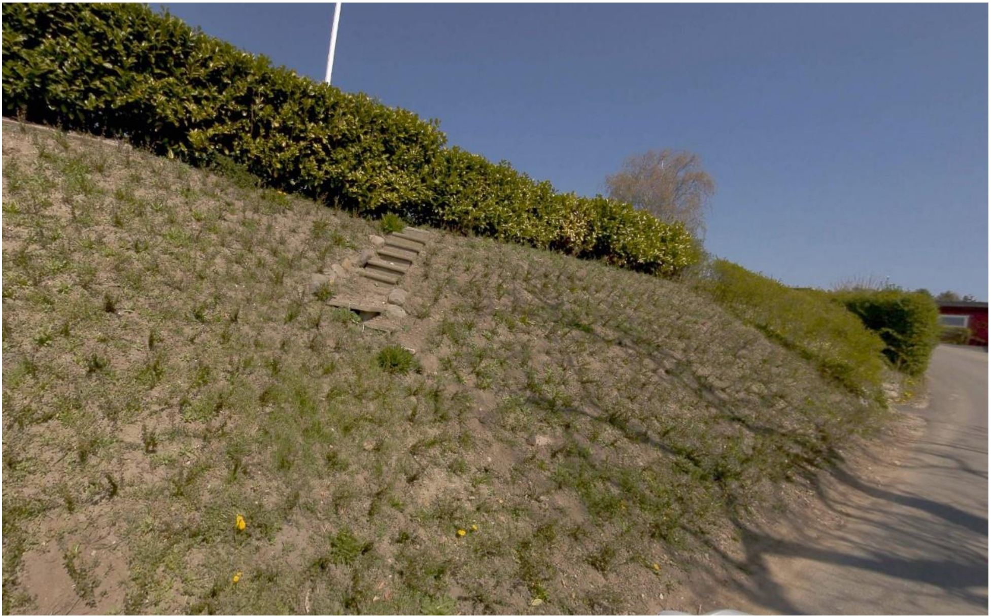
Skrænt for Violvænget 7 med delvist nedlagt trappe.