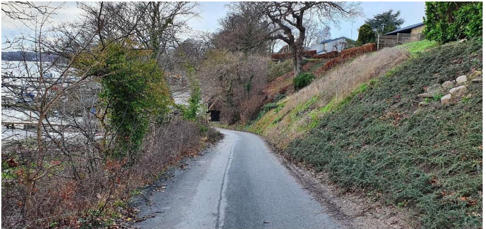
Gambøtvej set oppefra midt på den sydligste strækning. Til højre ses skrænt for hhv. Violvænget 7, 9 og 10.