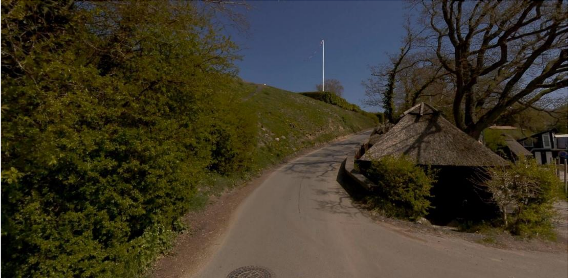
Gambøtvej set fra bunden. Fra venstre ses skrænt for hhv. Violvænget 10, 9 og 7. Til højre ses bevaringsværdige egetræer og fiske- og redskabshytter.