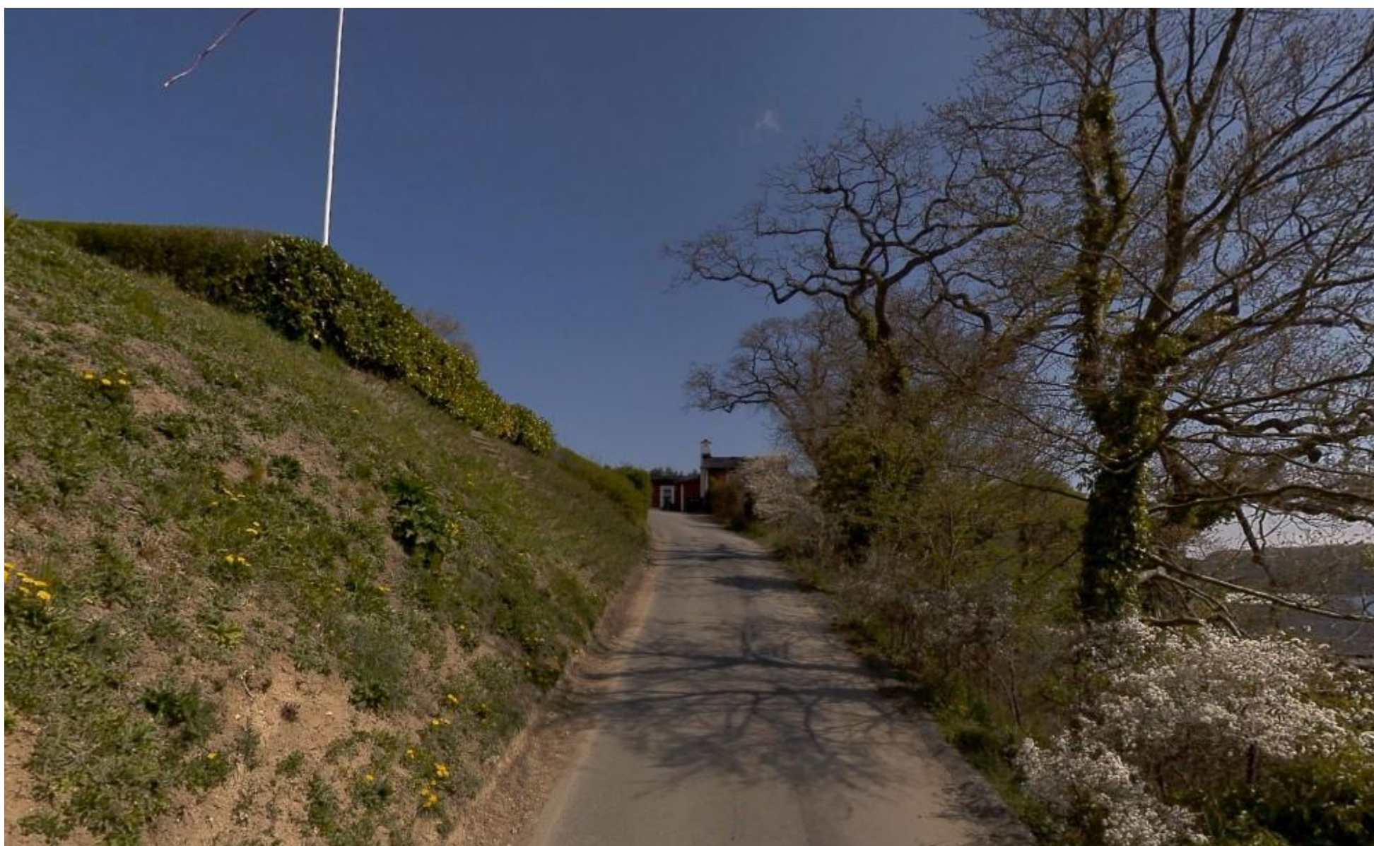
Gambøtvej set nedefra midt på sydligste strækning. Fra venstre ses skrænt for Violvænget 9 og 7. Til højre ses bevaringsværdige egetræer.