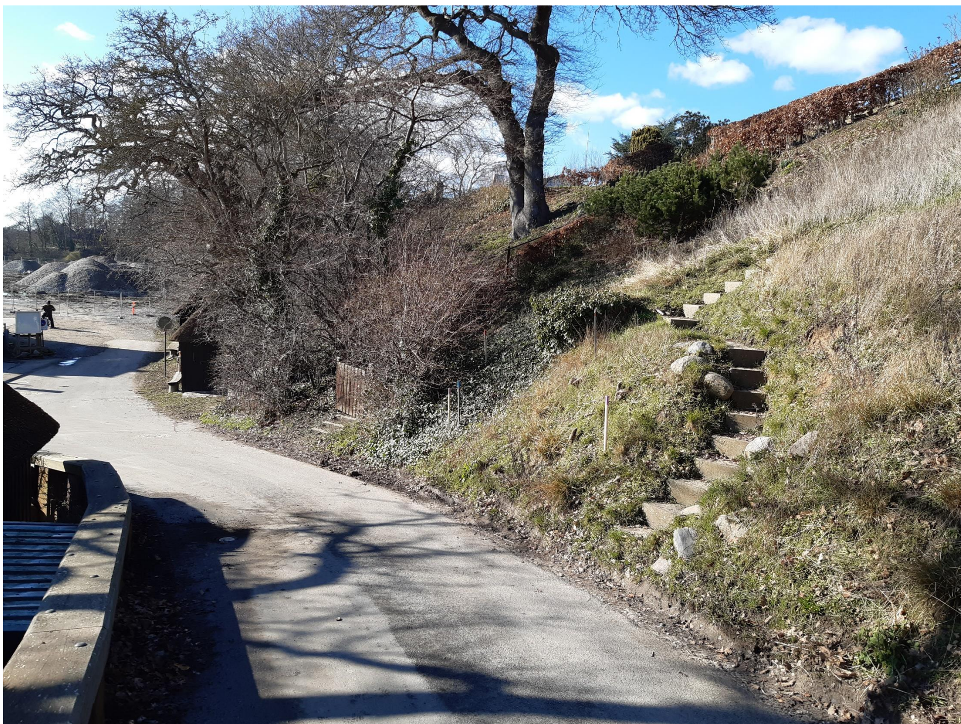
Gambøtvej set oppefra ved bunden af Gambøtvej. Til højre ses skrænt mod Violvænget 9 med eksisterende trappe og skrænt mod Violvænget 10 med trappe og låge.