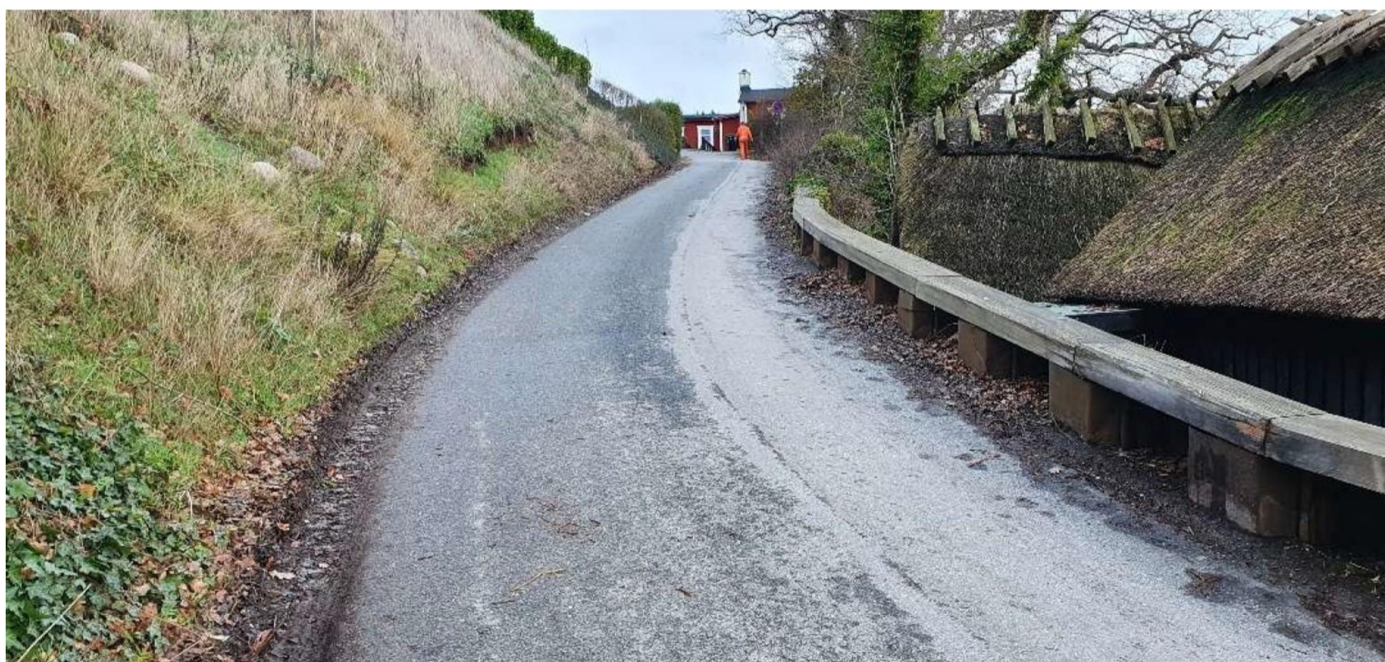
Gambøtvej med begrænsning mod syd af eksisterende spuns og bevaringsværdige fiske- og redskabshytter.