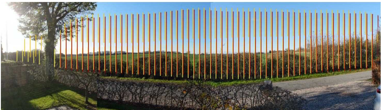
Figur 2 Eksempel på konsekvens af den foreslåede placering af det kompakte og massive boligbyggeri foran naboerne til byggeriet. Her ses den nuværende udsigt fra Egemosevej 48. Oven på fotoet er der med rødgule linjer markeret den højde på ca. 5,5-6 m over en ca. 160 grader vinkel, som initiativgruppe og arkitekten lagde frem på borgermødet d. 24.11-22. I det foreslåede byggeri er der ikke den transparens, som linjerne kunne indikere. Det er derimod massivt murstensbyggeri med tegltage, der foreslås.

Jeg kan forstå på lokale ejendomsmæglere, at det vil betyde et nedslag i vurderingen/prisen på vores bolig, hvis der bliver bygget som foreslået, så det eksisterende udsyn/udsigt forsvinder.