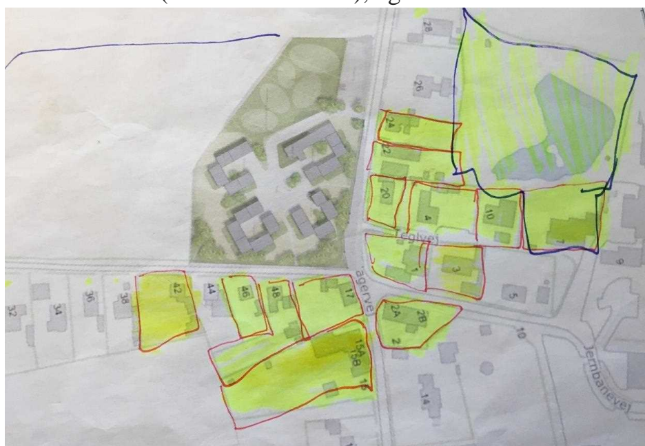
Figur 4 Beboerne rundt om det foreslåede bebyggelses-område på matriklen 2D har dannet en aktionsgruppe imod forslaget om placering, som vi alle er imod. De 14 matrikler i aktionsgruppen udgør ca. 12-15 procent af byens beboere. I øvrigt, på matriklerne Brudagervej 26 og Egemosevej 44 (der ikke er farvet gule) bor de tre initiativtagere.

Vi er 14 matrikler (se de gule markeringer på kortet figur 4), der ligger placeret rundt om det foreslåede område, der er gået sammen i en aktionsgruppe for at markere vores modstand imod det foreslåede byggeri.