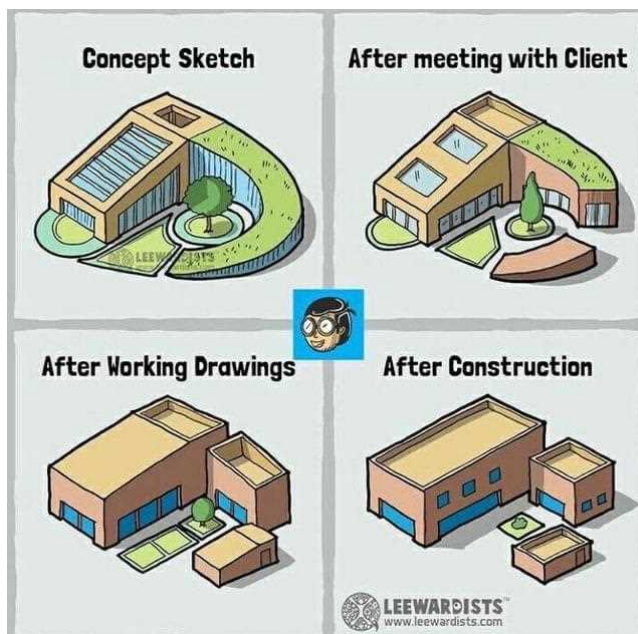
Figur 6 Det fremlagte forslag fra arkitekten ser ud som om vi allerede er nået til det fjerde niveau på den satiriske tegning ovenfor. Hvor er de faglige ambitioner om på fornem vis at forene funktion – æstetik og ressourcer i forhold til det konkrete byggeri på netop denne lokation?

Jeg vil opfordre til, at der bliver inddraget alternative arkitekter, hvis projektet skal fortsættes. Jeg har svært at se visionerne i det, der indtil nu er lagt frem? Det hidtil fremførte virker noget tilfældigt, defensivt og uden ægte engagement og fordybelse i de lokale forudsætninger, udfordringer og behov. I kommunens flotte arkitekturplan Arkitekturpolitik – fokus på værdi og livskvalitet, 2008 , står der bl.a.: ”Vi vil fremme de enkelte lokalområders særlige identiteter og styrker... vi vil sikre harmoniske overgange mellem landsbyerne og det åbne land... Vi vil indpasse nybyggeri, så det tager hensyn til landsbyens særlige skala og proportioner.”