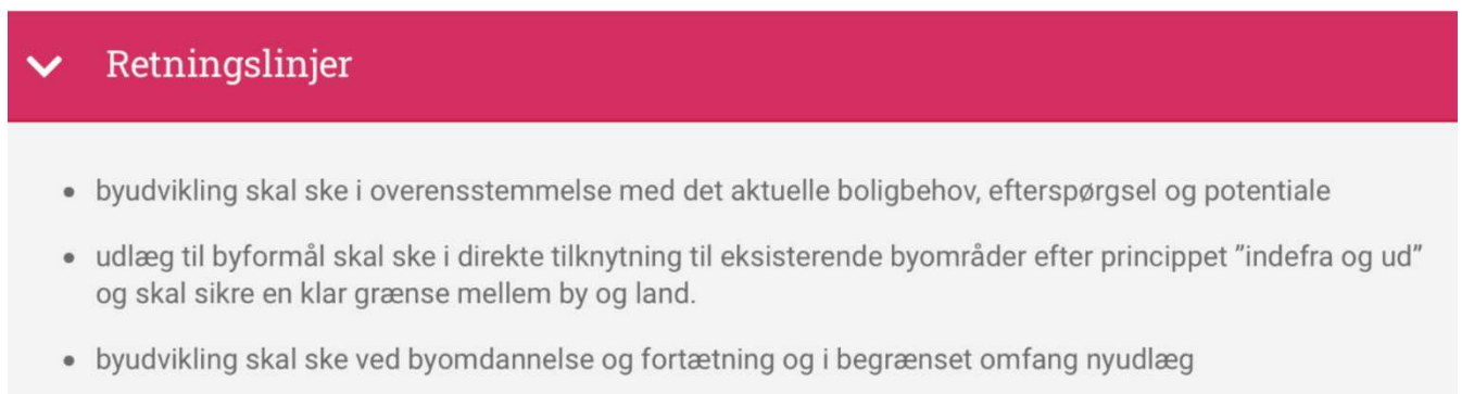
Figur 7 Uddrag af Svendborg kommunes retningslinjer for Byudvikling og bosætning.

Indefra og ud -perspektivet opfyldes for mig at se ikke med dette fremlagte forslag, men vil fx kunne alternativt opfyldes ved anvendelse af den gamle gartnerigrund i midtbyen.