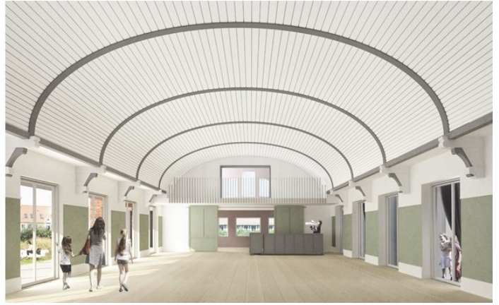
Virkeligheden og drømmen