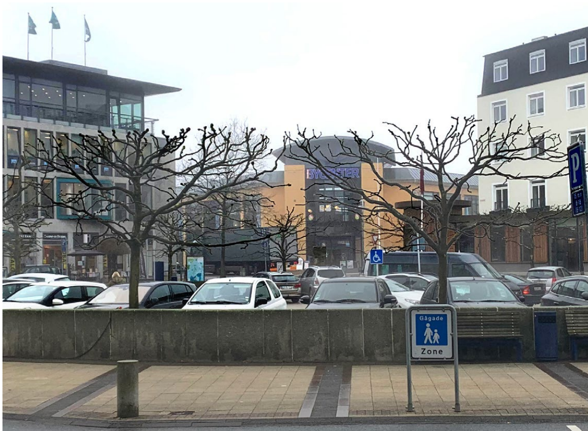
Hotel Svendborg ses til højre i billedet, Fynske bank ses til venstre mens det eksisterende bycenter ses i midten af billedet.

Et nyt byggeri kan bære et være markant højere mod centrumpladsen og spejle sig op af de større bygninger som Hotel Svendborg, Fynske Bank og Bygning på Centrumpladsen 8. Det vil samtidig muliggøre, at der kan arbejdes med et indgangsparti til centeret som også kan markerer sig i arkitekturen.