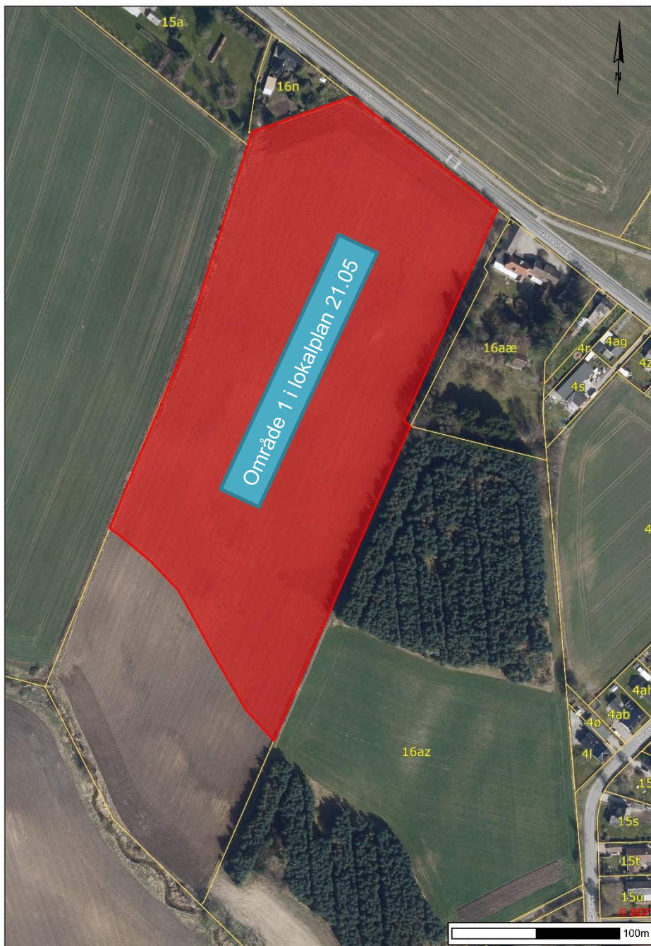
Afgrænsning af areal for aflysning