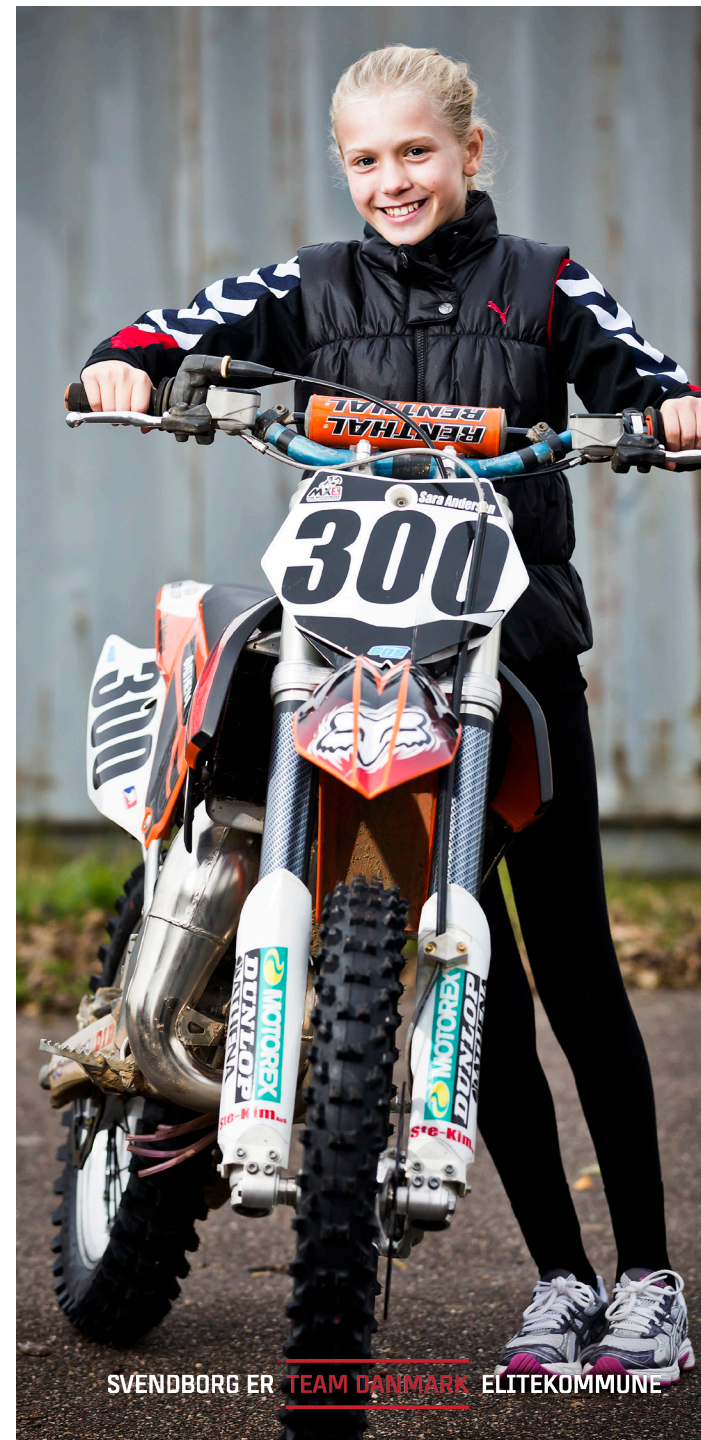
SVENDBORG ER TEAM DANMARK ELITEKOMMUNE

Undervisningen i ernæring kan i 7. klasse eventuelt kobles til faget hjemkundskab, og i 8. – 9. klasse kan