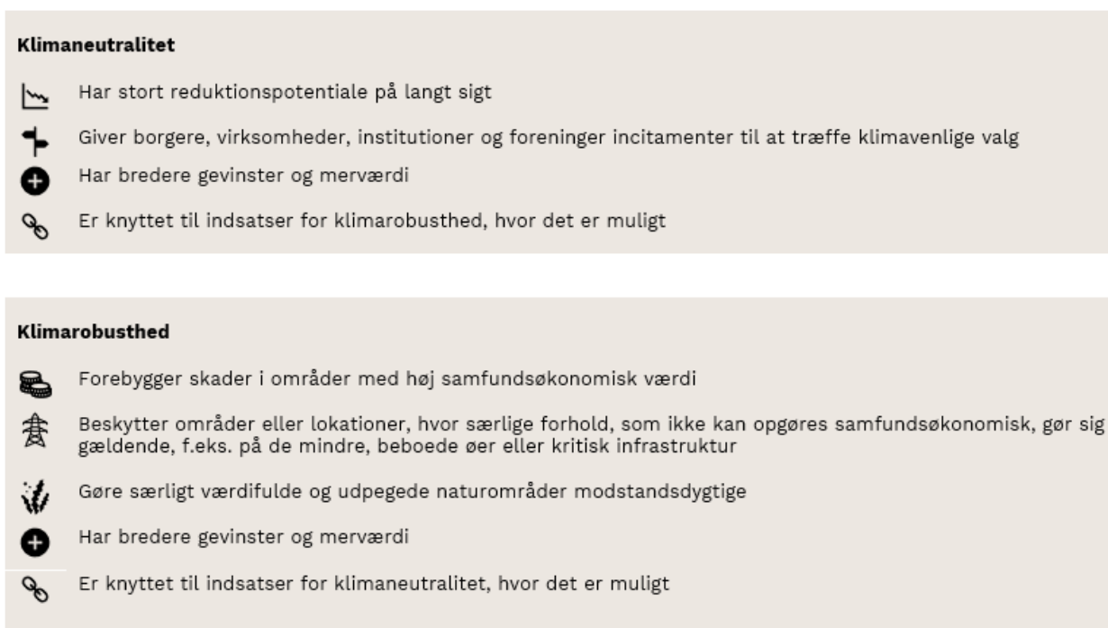
Figur 1: Principper for prioritering af klimaindsatser