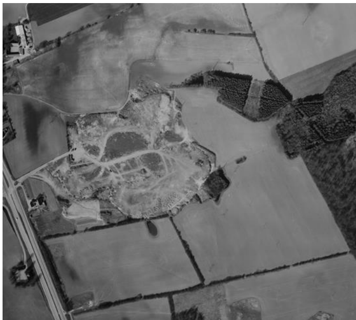
Svendborg banen i 1970'erne

Motorcykel klubben Svendborg (MCS) fyldte i 2016 90 år og har i dag ca. 170 aktive medlemmer i alderen 3 – 70 år. MCS har siden midten af 1970'erne været etableret på den gamle lodseplads på bodøvej 20. Lodsepladsgrunden er et fint underlag til en crossbane selv om der igennem tiden, og stadig gør, dukker interessante ting op ad jorden.