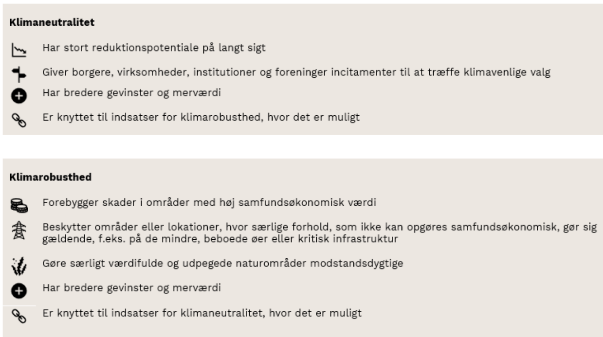
Figur 1: Principper for prioritering af klimaindsætser

og Teknik- og Miljøudvalgets møde den 13. januar 2022. Siden har administrationen foretaget en yderligere redigering af de principper der ligger til grund for udvælgelse af indsætserne. Principperne indgår i en samlet vurdering, og de er ikke angivet i prioriteret rækkefølge, se figur 1.