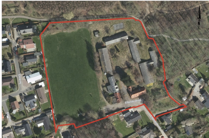
Lokalplanområdet vist på luftfoto

Der er modtaget 7 høringskommentarer fra borgere i området. Nogle af høringssvarene omfatter svar fra flere boligejendomme. Høringskommentarerne gengives i resumé. Derudover er høringskommentarerne vedlagt i deres fulde længde. (Jf. Bilag 4 - Samlede hørings svar ifm. foroffentlig høring, Efterskolevej.)