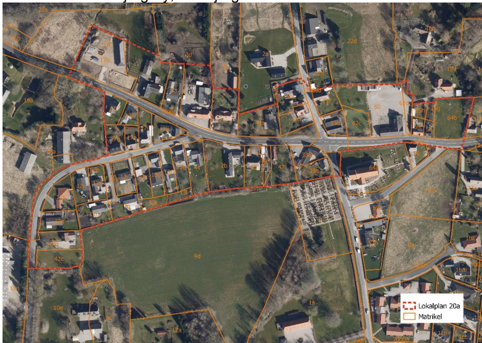
Lokalplan 20a med den gældende afgrænsning

Matriklen er pt. udlagt til boligområde i kommuneplanen og i lokalplan 20a. Kommunen ønsker at tillade den ønskede anvendelse, da kommunen samtidig vurderer at anvendelsen samt de bebyggelsesregulerende bestemmelser i den lokalplan 20a er forældede og uaktuelle for den pågældende matrikel. En ansøgning om opførelse af en bolig, kan kun forhindres ved at kommunen nedlægger et §14 forbud. Svendborg Kommune vælger derfor at ophæve lokalplan 20a for den del som omfatter matrikel 64b Gudbjerg By, Gudbjerg.