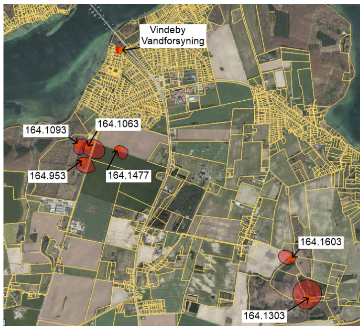
Figur 3. Oversigt over borer og tilhørende BNBO'er ved Vindeby Vandforsyning. BNBO er markeret med rød.