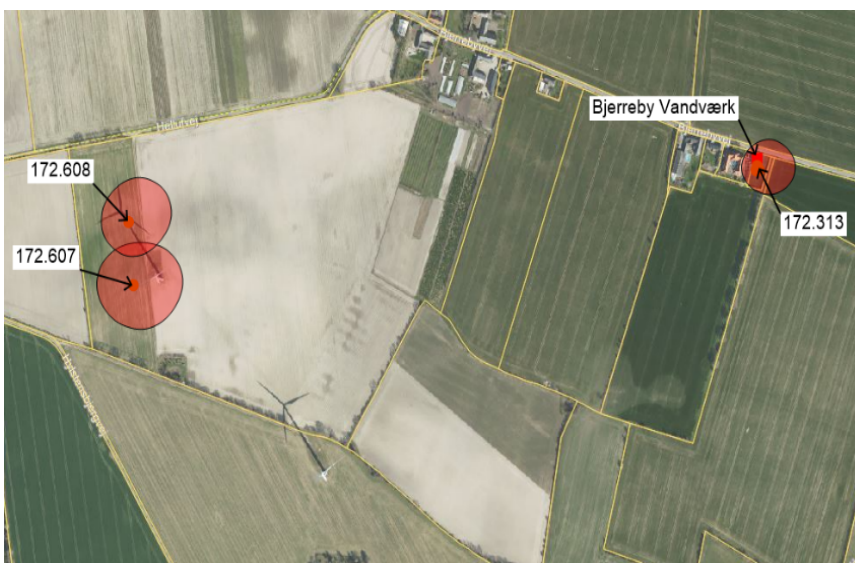
Figur 1. Oversigt over borerer og tilhørende BNBO'er ved Bjerreby Vandværk. BNBO er markeret med rødt.