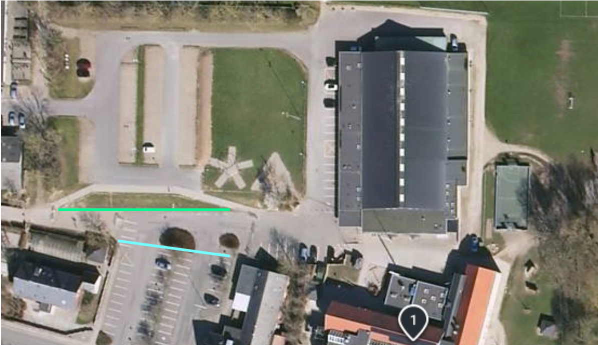
Billede 2 - FØR: Nuværende hegn med grønt, EFTER: Rykket hegn med blå.

blive en naturlig del af pumtracken og lyse op, når det bliver mørkt, så tracken også kan bruges om aftenen.