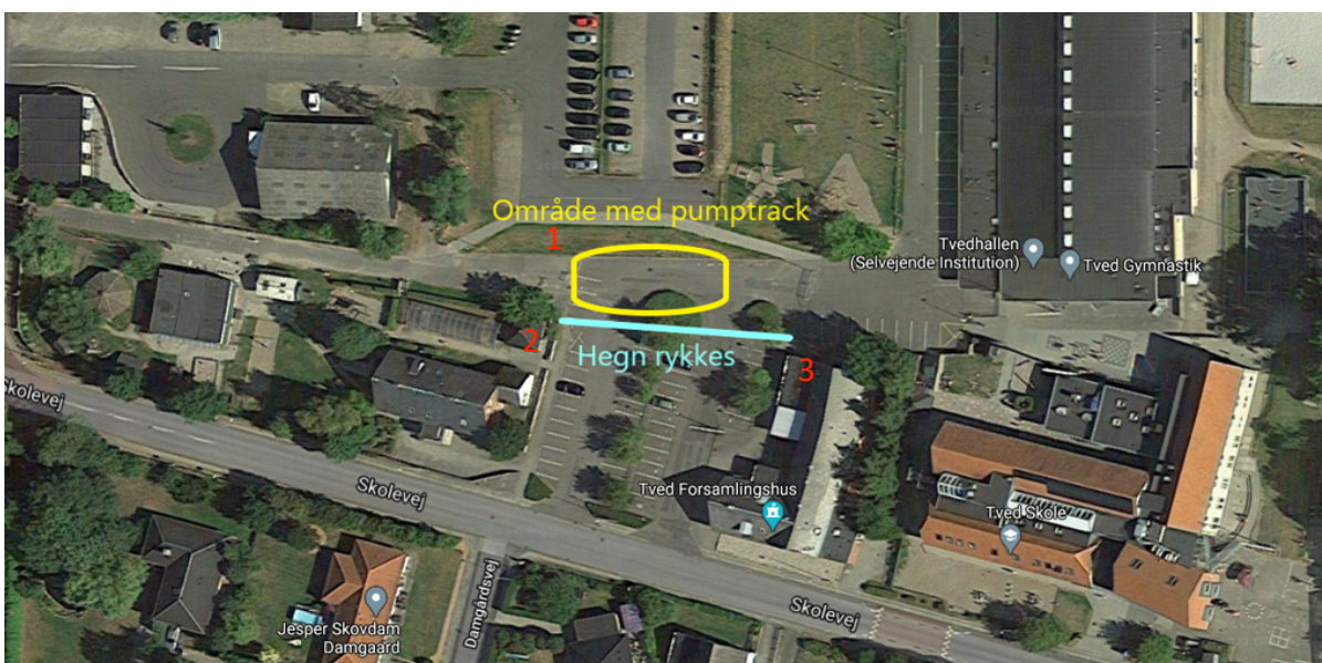
Billede 3 - Forslag til pumtrack placering.

Pumtrackens præcise størrelse er en professionel vurdering, men uanset hvad, vil den kunne være indenfor det rykkede hegn og placeret mellem skråningen med græs 1 , den lille sløjde-hytte 2 og for enden af Tved Forsamlingshus 3 , se billede 3.