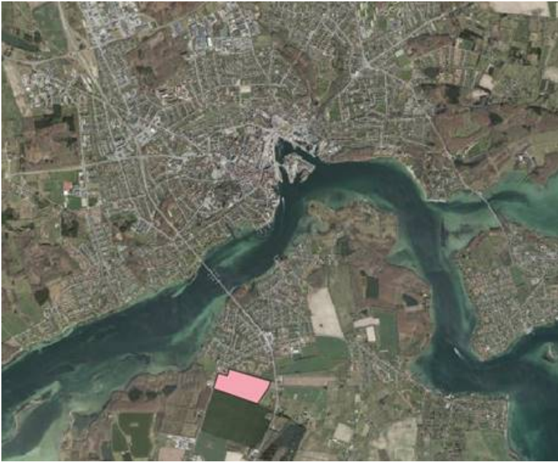
Kortbilag, nyt rammeområde til boligformål