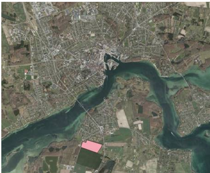
Kortbilag, nyt rammeområde til boligformål