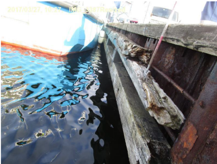
St. 67 (talt fra nordligvestligt hjørne), fendertømmer mangler lokalt.

Anoder, fendertræ og hammer er nedslidt og ødelagt. Det medfører at kajen ikke kan benyttes uden, at der kan ske skade på skibene, der ligger til, og at stålspunsen begynder at blive nedbrudt. Der monteres nye anoder i det omfang det er nødvendigt, etablering af nyt fendertræ og hammer. Når der skal etableres sluser, vil det være nødvendigt at afmontere en del af fendertræet og hammeren.