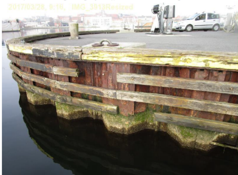
St. 90 (talt fra nordligvestligt hjørne), fendertømmer mangler lokalt.