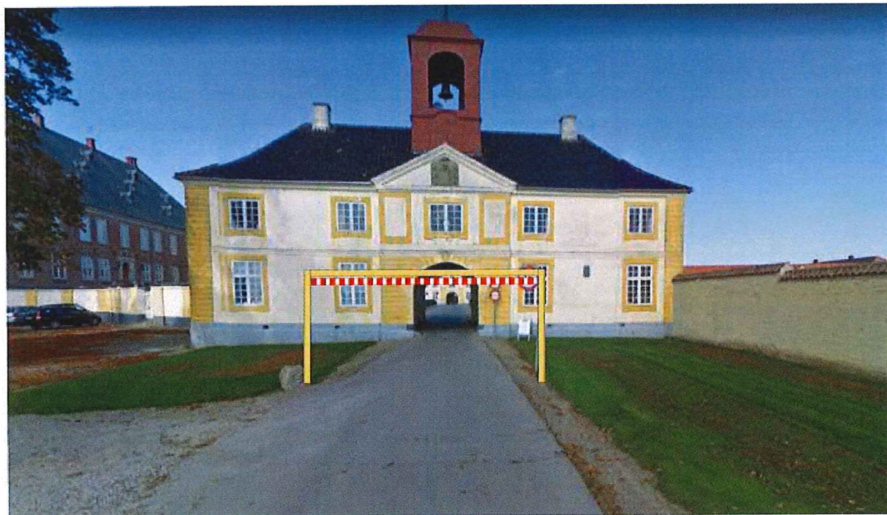
Svendborg Kommunes forslag til højdeportal (indarbejdet i forslag 4)