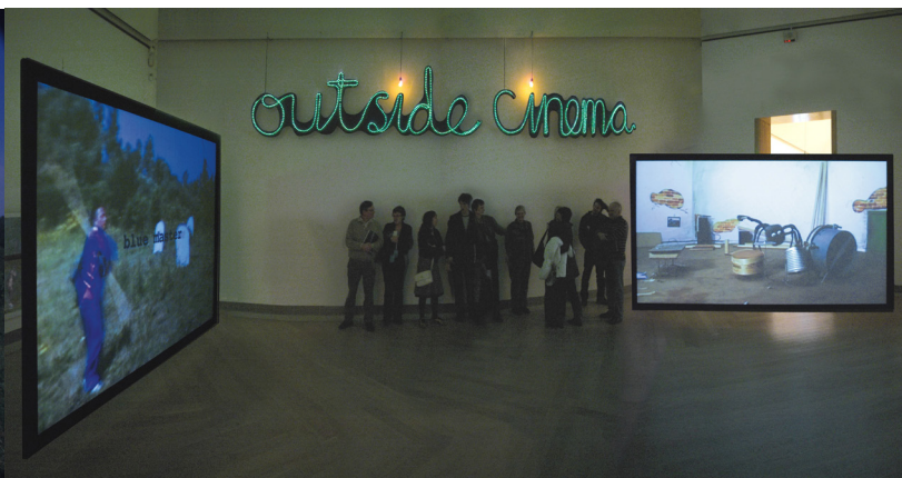
Dokumentationsfoto af Crossing, Moderna museet Stockholm