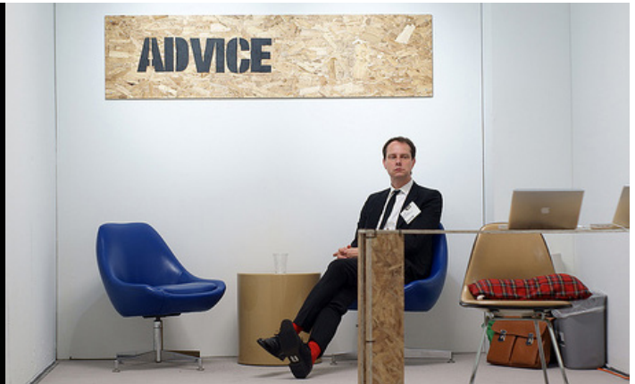
Dokumentationsfoto af It's a Small World, After All, 2012