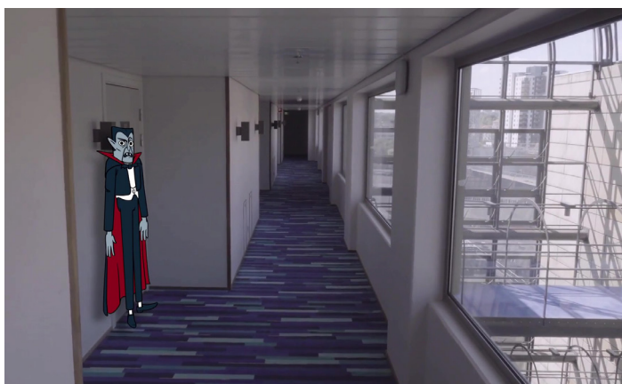
Still fra video OS, 2019

Piscine arbejder med en form for kritik af de normer som vi lever under, gerne blandet med et komisk elementer og kommentarer som f.eks. animations iguren i OS, en lidt sød bloddrikkende vampyr der bevæger sig rundt i det menneskeskabte landskab.