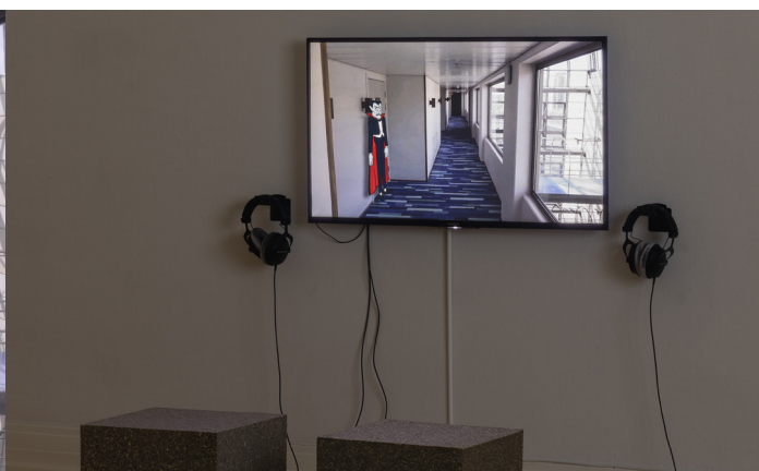
Dokumentationsfoto af OS, Kunsthal Aarhus