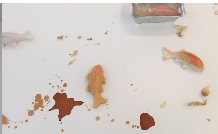
Dokumentationsfoto af Indoors, 2018, Sydhavn Station