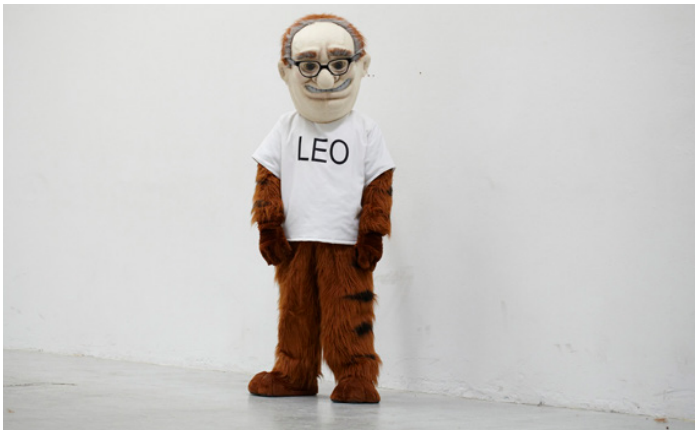
Dokumentationsfoto af LEO, 2011 IMO-projects