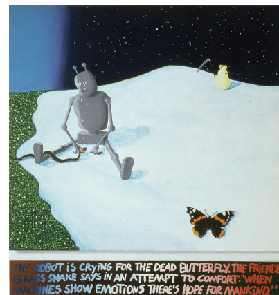
THE ROBOT IS CRYING FOR THE DEAD BUTTERFLY. THE FRIENDLY SNAKE SAYS IN AN ATTEMPT TO COMFORT: "WHEN MACHINES SHOW EMOTIONS THERE'S HOPE FOR MANKIND."