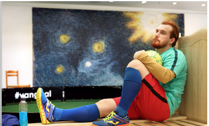
Dokumentationsfoto af #vangoal, 2017 TRANEN