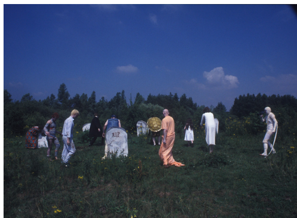
Still fra 2 kanals videoinstallation Crossing, 2006

Lisas videoværk Crossing mødes to verdner; en modeleret edderkop som udføre sine gøremål, skriver på et manuskript, mens der skifter filmspoler i en udendørsbiograf. Samtidig afspilles filmen, fra filmspolen, hvor zombier lave tai chi sammen med the blu-mastre på en kirkegård.