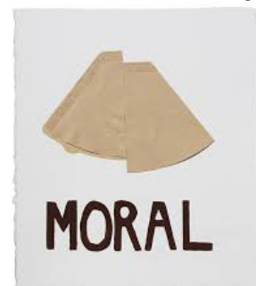
Moral, 2017 Gouache/collage