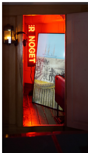
Dokumentationsfoto af Historien er noget rod, 2019 på Fregatten Jylland