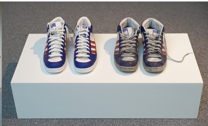
Dokumentationsfoto Et år i to afgrænsede rum, 2006