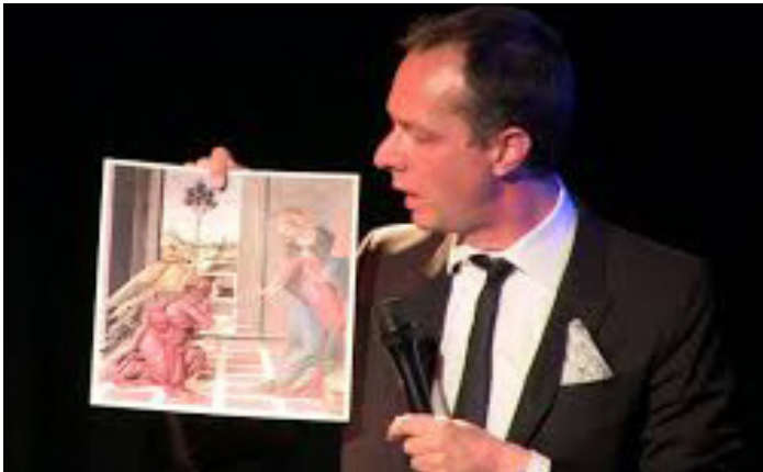
Dokumentationsfoto af Driving the Blues Away 2014

Olof arbejder i et felt af personlige, nogle gange paranoide, erfaringer op imod den absurde og urimelige dele af den kapitalistiske magt i vores samfund.