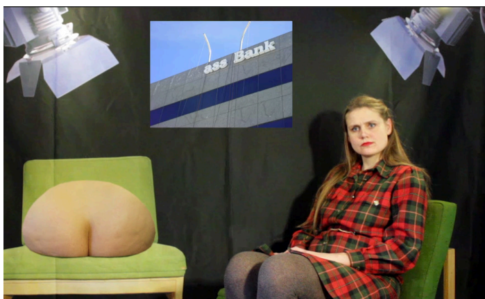
Dokumentationsfoto TALKING OUT OF MY ASS