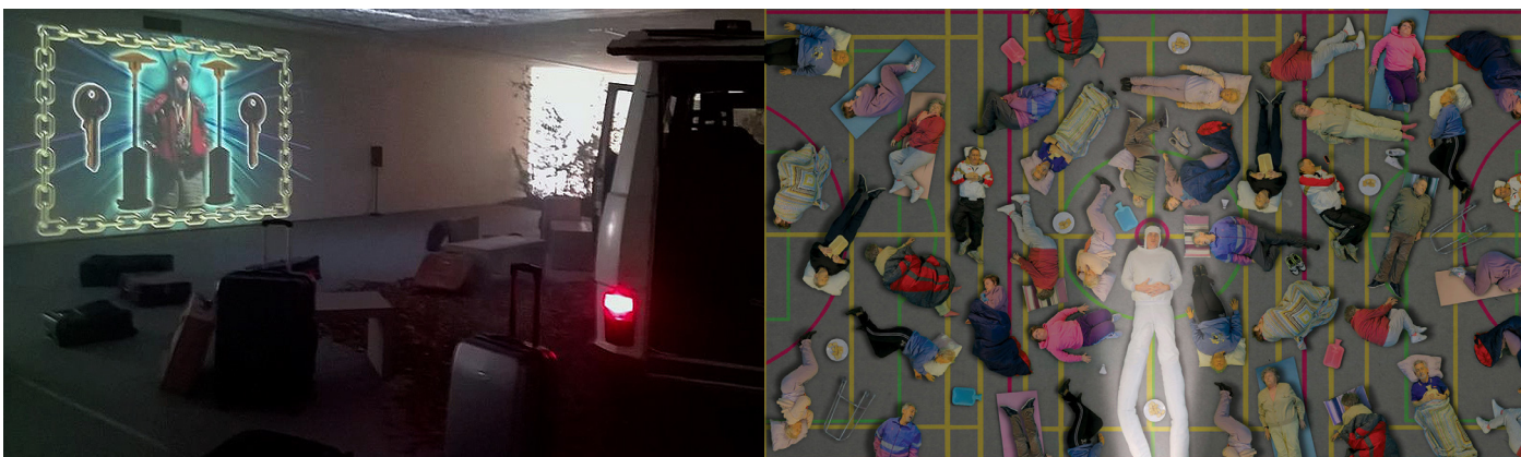
Dokumentations foto af ECHT på Vestjyllands Kunstpavillon, 2015

Bedwyr er inviteret på et eksisterende videoværk ECHT, 2014. Bedwyr skal også bidrage til Fyns Amts Avis med noget nyt. Bedwyr arbejder med det surreelle og absurde i vores tid, som i videoen ECHT, hvor vores verden bryder sammen og reaktionen fra os mennesker er ren egoisme og trang til at hamstre ting og vende op og ned på magten.