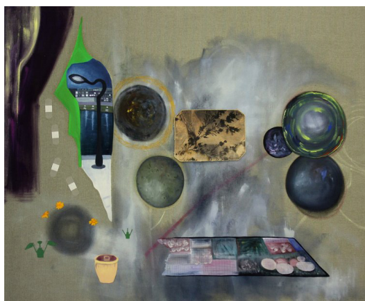
Dokumentations af Det levede i mit nabolag, nu er det flyttet ind i min have og mit hus, 2016