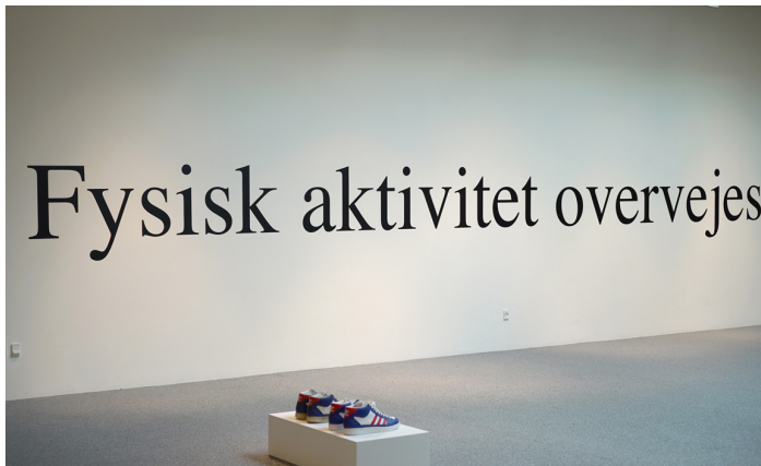
Dokumentationsfoto af Fysisk aktivitet overvejes, 2016