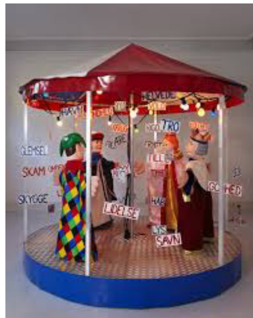
Karrusel, 2009-2010, Galerie Mikael Andersen