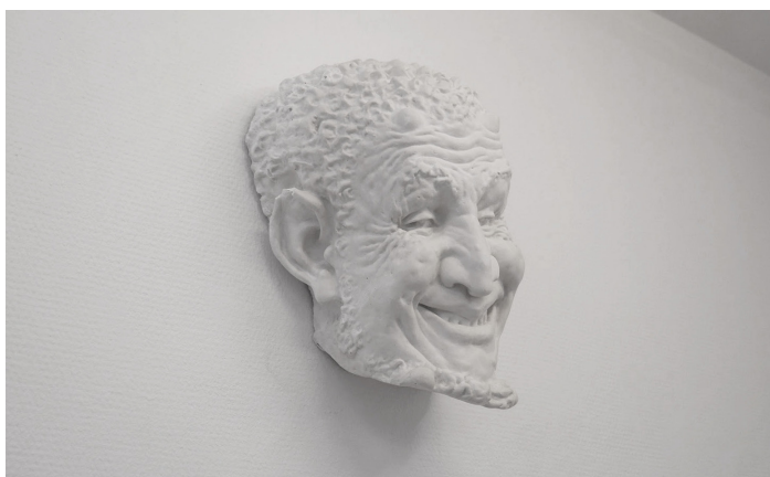
Dokumentations foto af Faun with Broken Ears, 2018