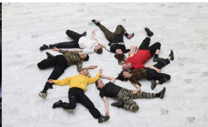
Dokumentations foto af ZOMBIEHÅND, 2018 TRANEN