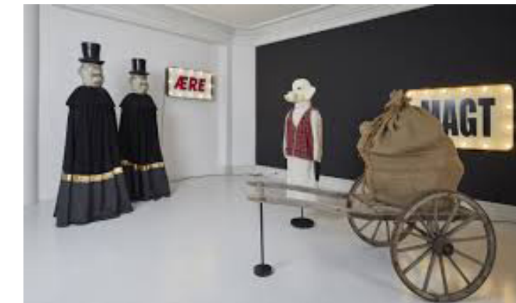
Dokumentationsfoto af Profane Theatre - The Trilogy, part 2-3, 2017, Galerie Mikael Andersen