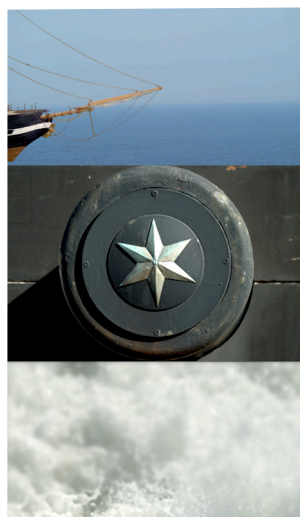
Stills fra Historien er noget rod