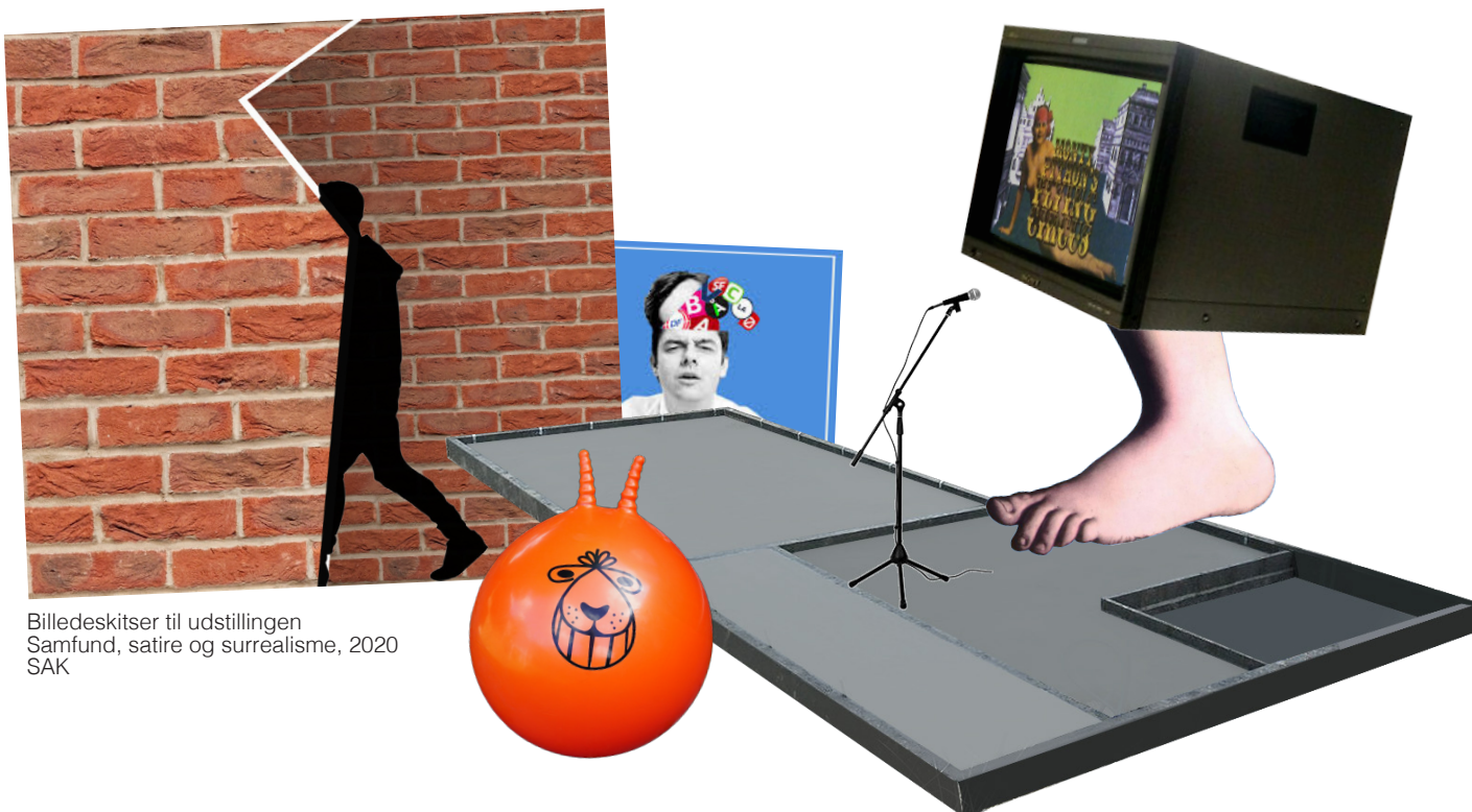
Billedeskitsjer til udstillingen Samfund, satire og surrealisme, 2020 SAK

Konkret på udstillingen vil indgangspartiet bygges op som en mur, en fake rødstensmur, med en revne som åbning, så man bliver gjort opmærksom på, at man træder idenfor på udstillingen og dermed træder ind bag facaden. På øverste etage på SAK skal der bygges en scene udformet som et hus-fundament. Her vil der løbende, under hele udstillingen, være performans, stand-up (vores tid satire), samt arrangementer af Fyns Amts Avis. Fundamentet bliver et symbol på et demokratisk samfund som der kan tales frit i. Alle værker og lånte materialer vil blive formidlet på udstillingen, samt i avisen, som man kan tage med hjem.