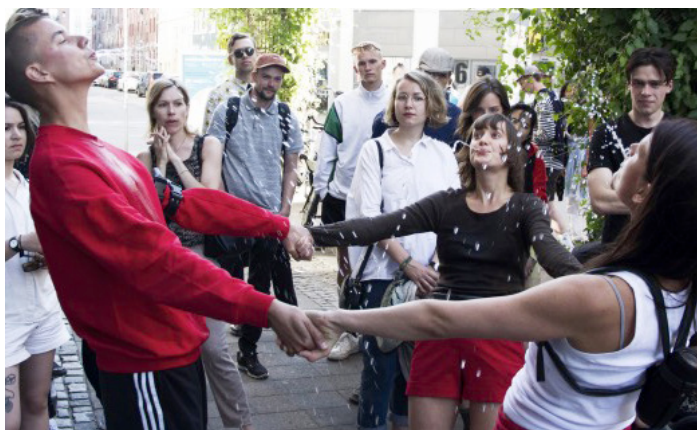
Dokumentations foto ROMANCE, 2018, Kvit Galleri

Jules er inviteret til at producere et nyt værk til udstillingen samt bidrage til Fyns Amts Avis med noget nyt. Jules arbejder æstetisk og skulpturelt, i sine performans, med sans for de dele af samfundet, som ikke besidder magt, men tvivl i sin rene skønhed, som findes i ungdommen, i fysisk form. Følelsen af at stå midt imellem noget, som ikke har en fast udformning men som giver plads til livets flertydigheder med effekter fra virkeligheden.