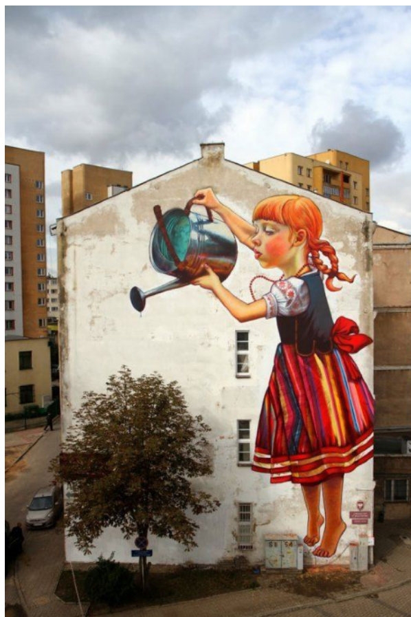
Se flere eksempler på gavlmalerier her og her

20 PORTE OG DØRE langs Møllergade vil løbende blive udsmykket; skæve og farverige billeder skal skabe undren og glæde i hverdagen og måske give et vink om, hvad der gemmer sig bag porten. Indsatsen vil være en løbende proces, der påbegyndes umiddelbart og strækker sig over længere tid. Gaden vil op til festivalen i 2021 gradvist blive transformeret til en mangfoldig oplevelsesgade. Der indgås aftale med de enkelte ejere ift. tilladelse og motiv, og umiddelbart indgås der aftale med Svendborg Street Art.