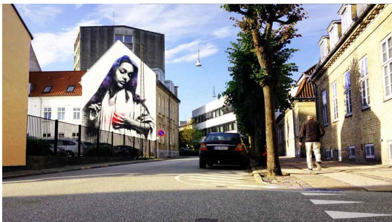
El Mac -Urbansgade 45 - Aalborg

** Selve festivalen forventes afviklet med et stort antal frivillige fra foreningen og der søges også uformelle sponsorater og samarbejdsaftaler i området fx Salling Group/Føtex. Budgetposten skal umiddelbart dække: leje af lyd anlæg, afspærring af vej, tilladelser, materialer til workshops, publikumspris og pannedeltager honorar, tryksager mm.