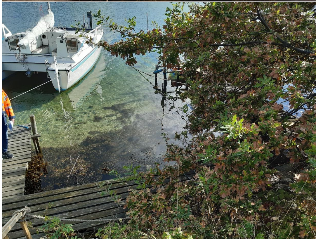
Både og broanlæg ud fra dæmning, Svendborgsiden