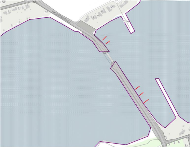
7. september 2020 – Besigtigede broanlæg langs Thurødamning