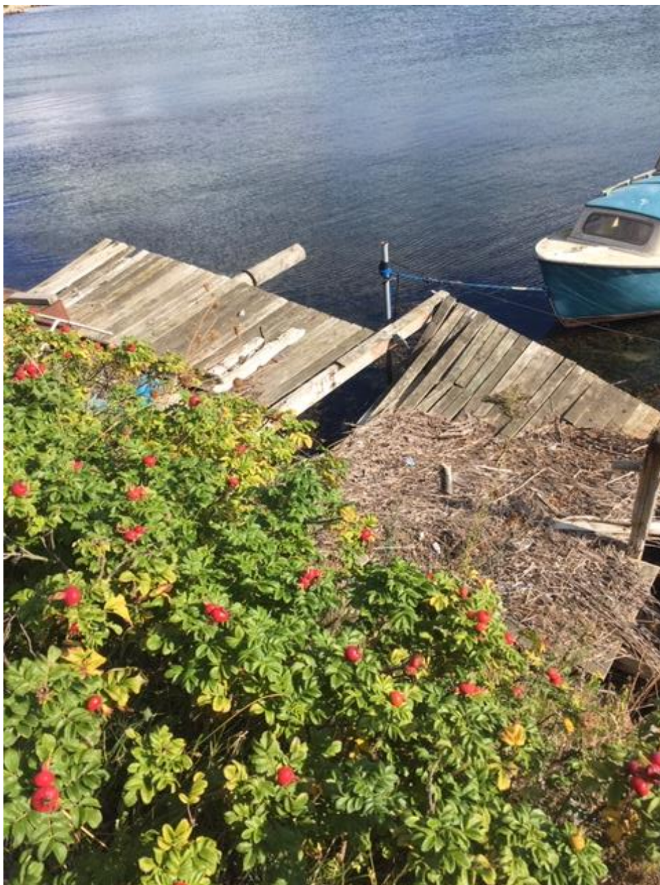
Broanlæg ud fra dæmning, Thurørsiden