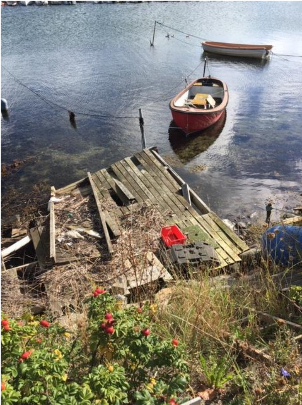
Broanlæg ud fra dæmning, Thurørsiden