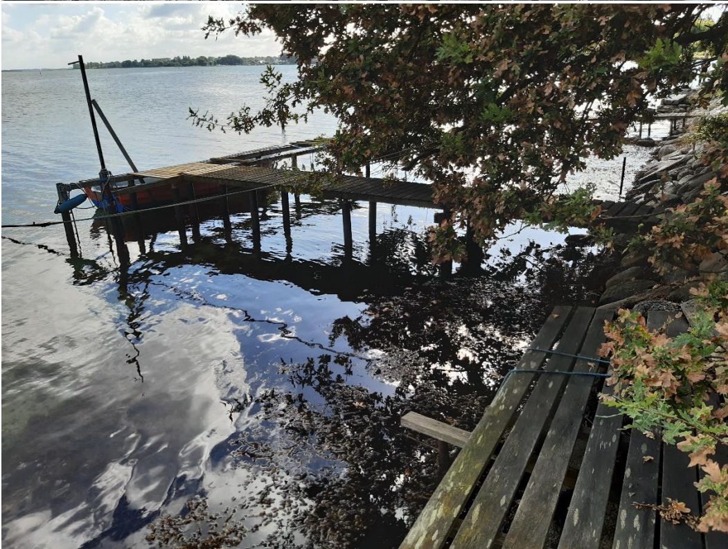
Broanlæg ud fra dæmning, Svendborgsiden