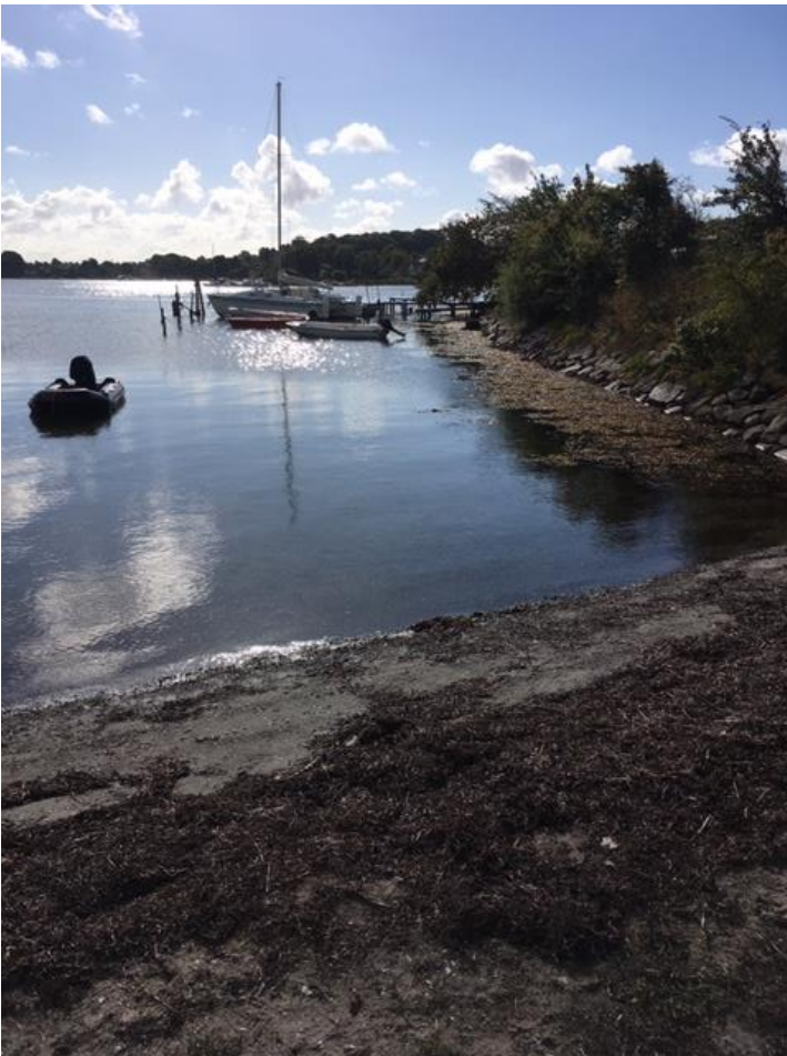
Fortøjede både og broanlæg ud fra dæmning, Svendborgsiden