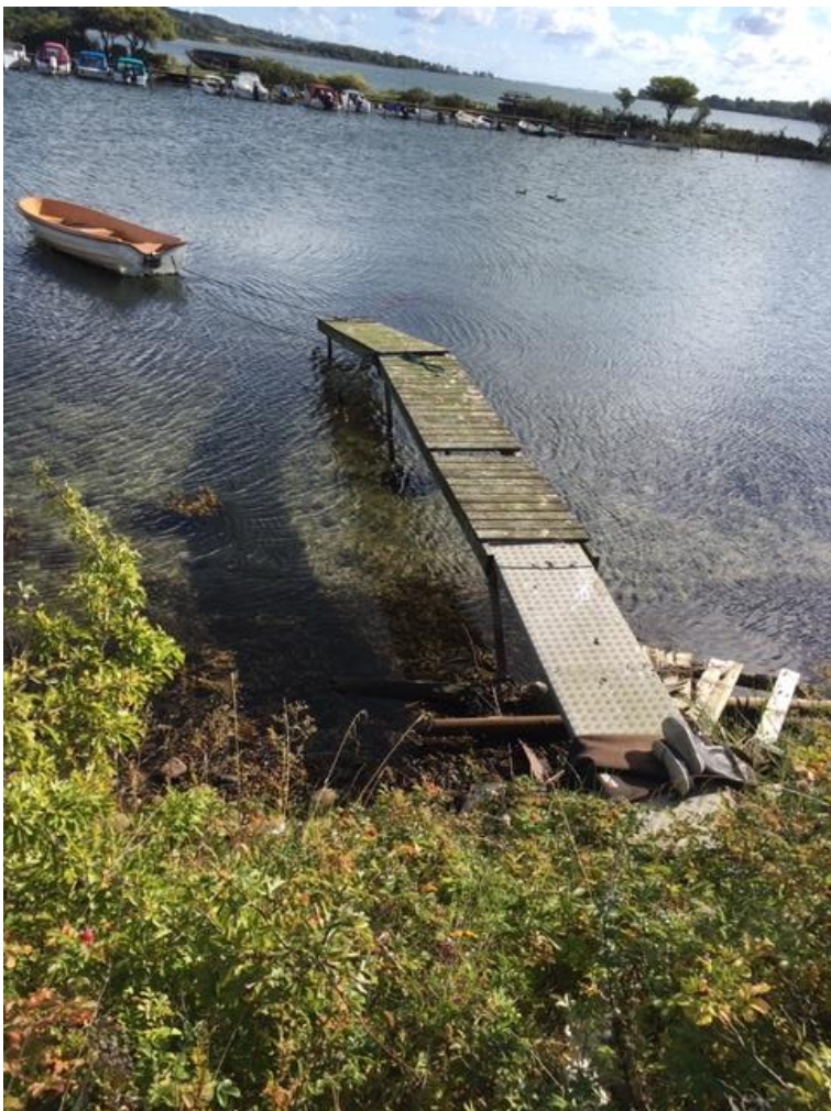
Broanlæg ud fra dæmning, Thurø siden