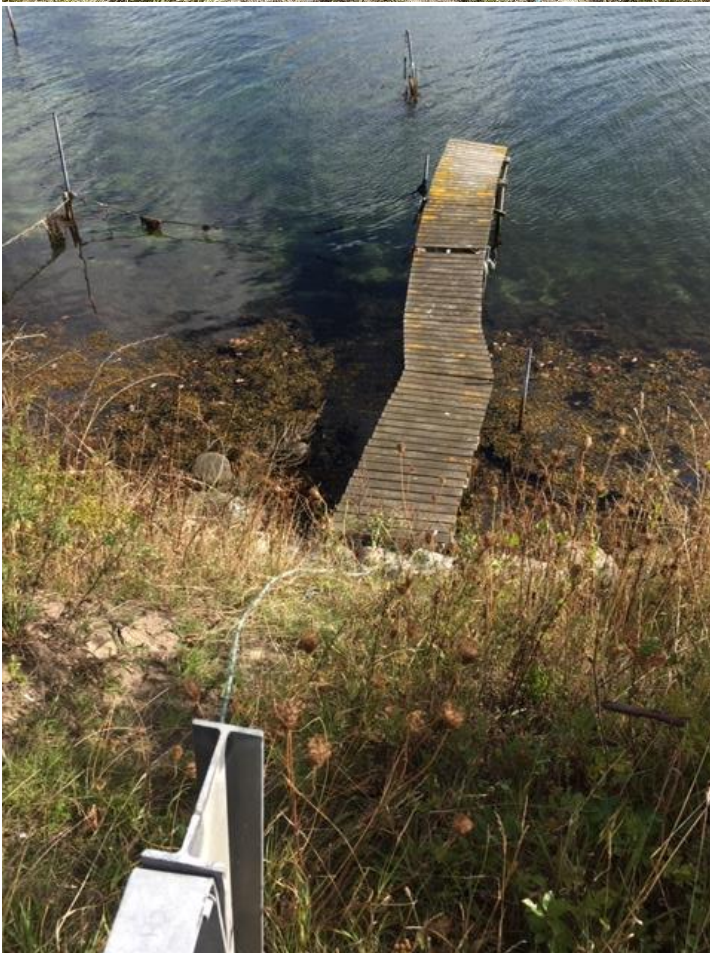
Broanlæg ud fra dæmning, Svendborgsiden