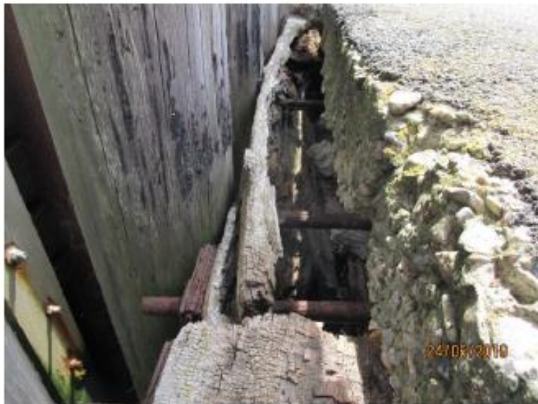
Nederste bjælke er udhulet og mangler lokalt helt.