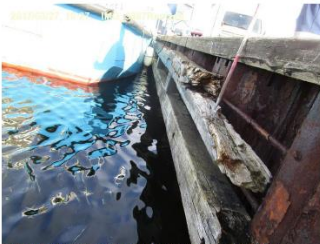
St. 67 (talt fra nordligvestligt hjørne), fendertømmer mangler lokalt.