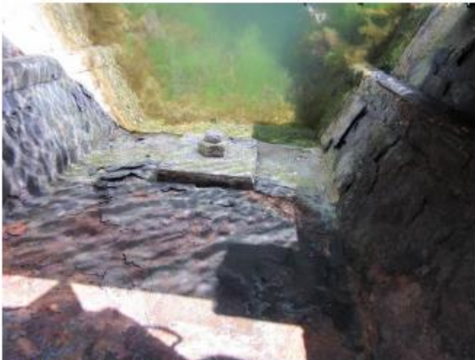
Lamineret korrosion ved splashzone