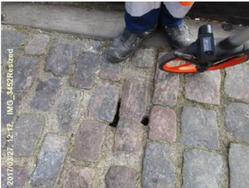
Tegn på underskylning/erosion under brostensbelægning ud for havnekontoret.