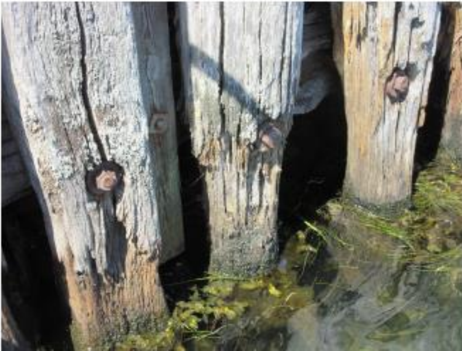
Kraftig råd og forvitring i splashzonen