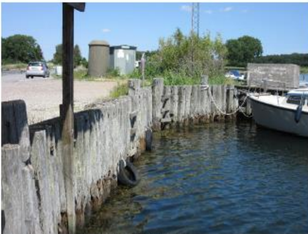
Oversigt over østsiden ved kajindfatning