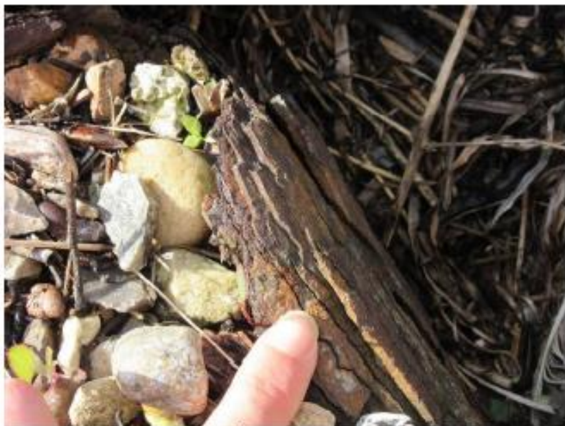
Synlig lamineret korrosion på spunsvæg