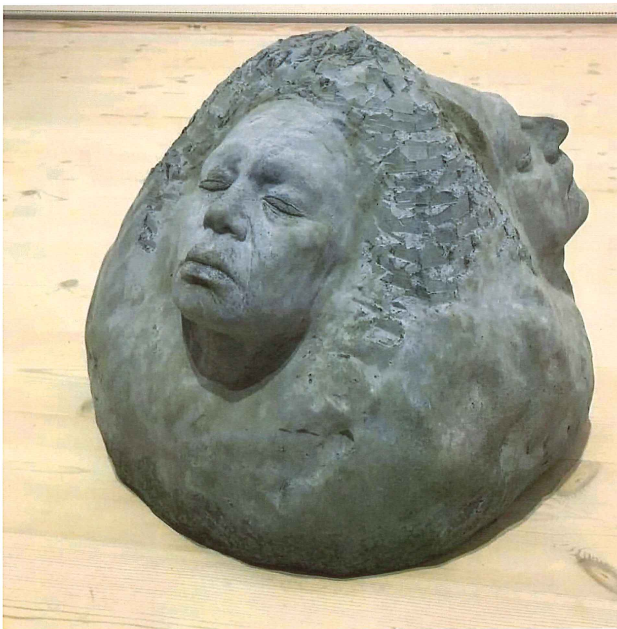
Lilibeth Cuenca Rasmussen, Meteorit (familieportræt), beton, 45 X 55 X 60 cm

Skitse. En lignende skulptur ønskes opsat i haven foran Work2gether