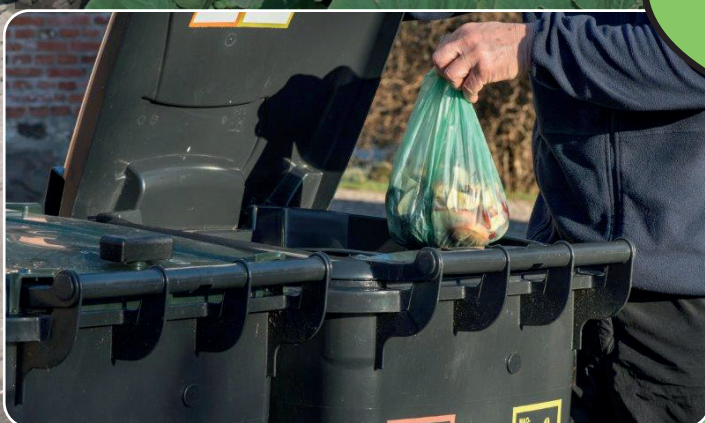
Mere affaldssortering bliver en realitet i 2020.