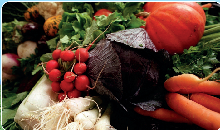
Økologi og årstidens lokale råvarer er i fokus.