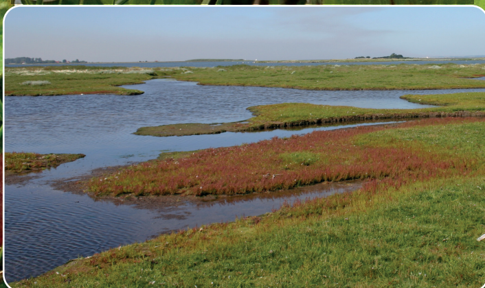
Strandenge er karakteristiske for Det Sydfynske Øhav.