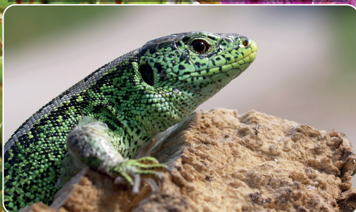
Markfirben stiller særlige krav til levesteder.