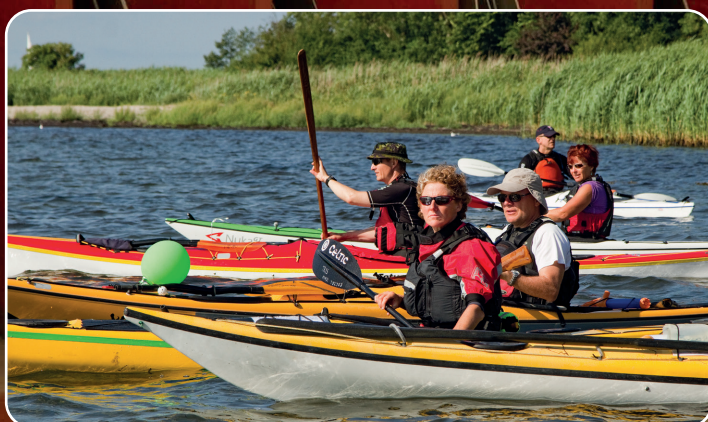
Øhavet tiltrækker turister, blandt andet havkajakroere.