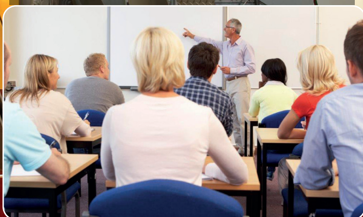
Antallet af unge uden arbejde eller uddannelse skal reduceres.