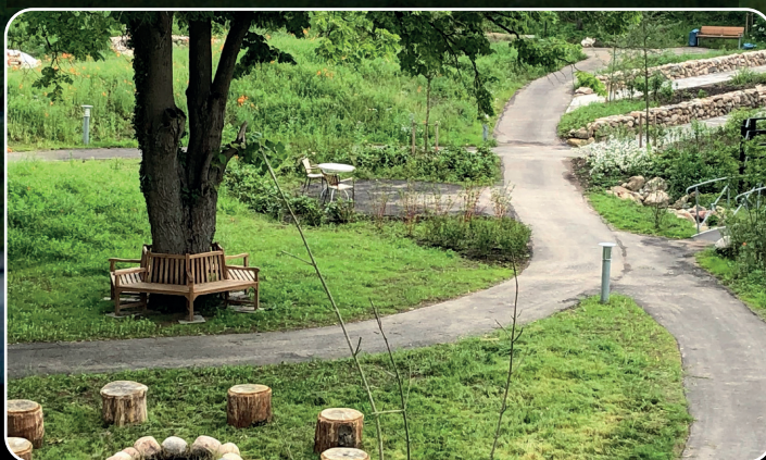
Demensbyens have giver aktivitetsmuligheder og livskvalitet for beboerne.