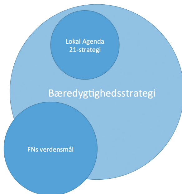
Figur 1: Svendborg Kommunes bæredygtighedsstrategi er vores Lokal Agenda 21-strategi samt vores fokus på udvalgte FN verdensmål.

En Lokal Agenda 21-strategi skal indeholde beskrivelse af, hvordan kommunen vil mindske miljøbelastningen, fremme biologisk mangfoldighed, fremme samspil mellem beslutninger om miljø, økonomi og sociale forhold samt inddrage befolkning og erhvervsliv.