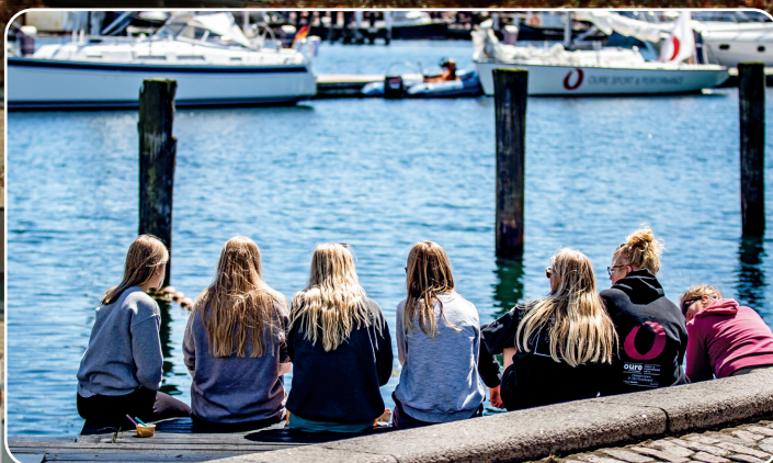
Cittaslow- det gode liv - er også mødet mellem by og havn.