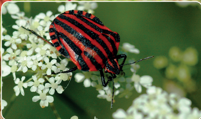
Stribetæge - et smukt insekt, der lever i naturvenlige haver.