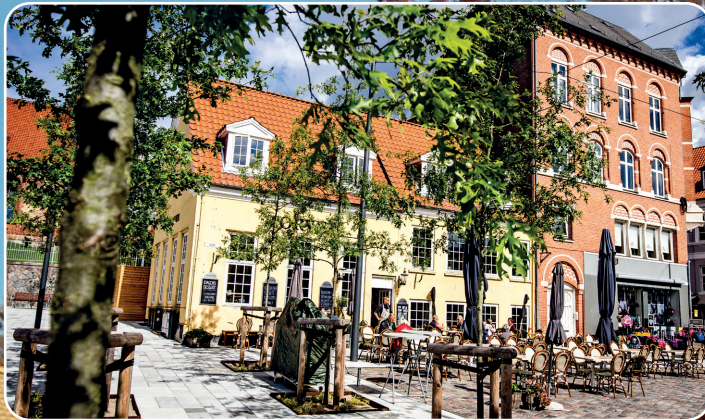
Træer i byrummet skaber oplevelser og stemning i byen.