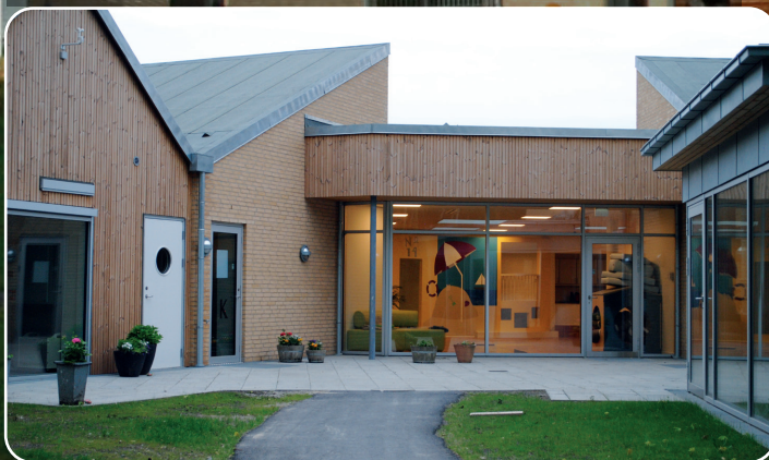
Daginstitutionen Humlebien er DGNB-certificeret.