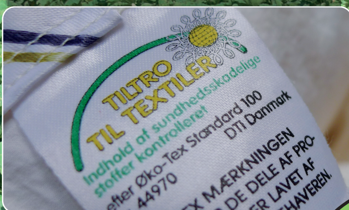
Miljøcertifikater sikrer et mere miljøvenligt valg.