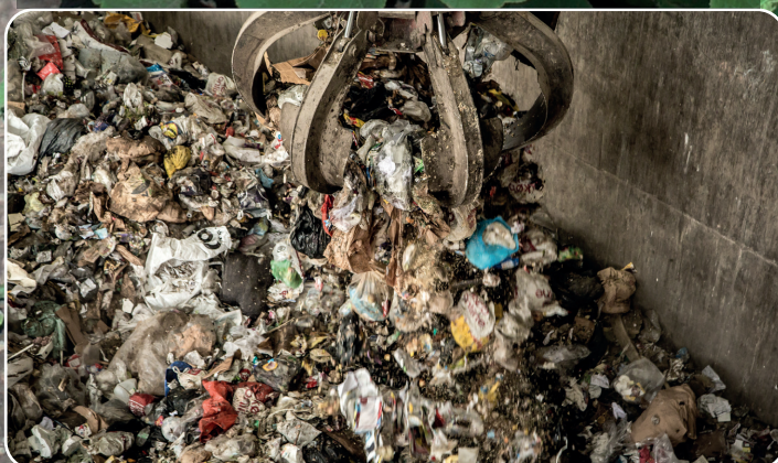
Restaffaldet afbrændes hos Svendborg Kraftvarme og bliver til varme for Svendborg Fjernvarmes kunder.

"Efterspørg lokale økologiske produkter. Det kan skabe arbejdspladser." Input fra borgermøde