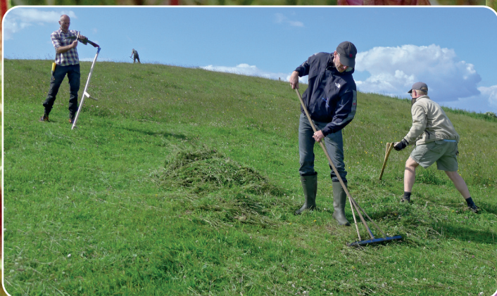
Høstet gavner biodiversiteten.