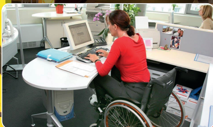
Flere handicappede skal i arbejde.