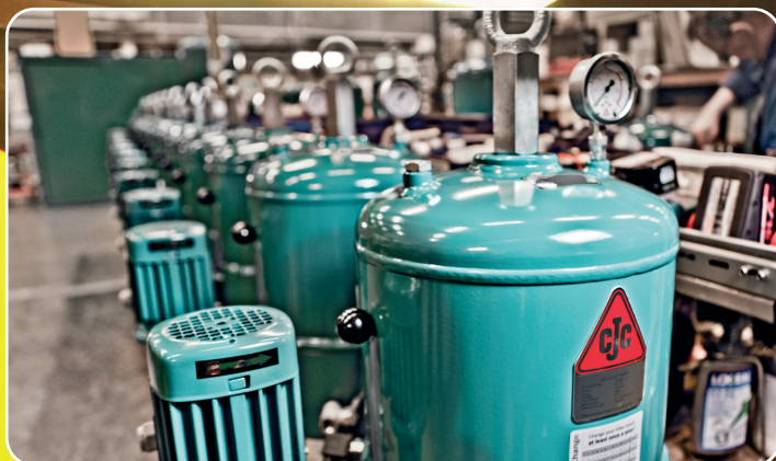
CC Jensen – en lokal virksomhed, der arbejder med cirkulær økonomi indenfor oliefiltreringsløsninger.