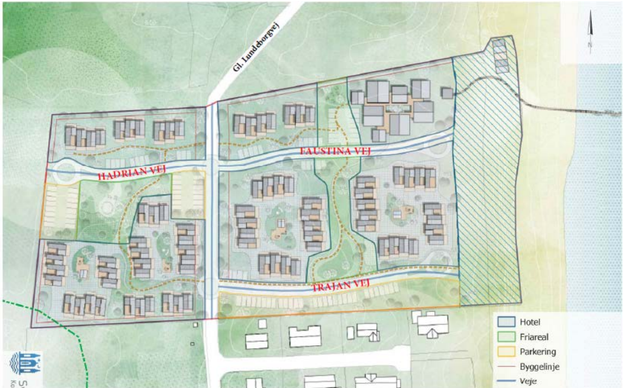
Forslag til nye vejnavne ved Lundeberg Badehotel – Hadrian Vej, Faustina Vej og Trajan Vej.