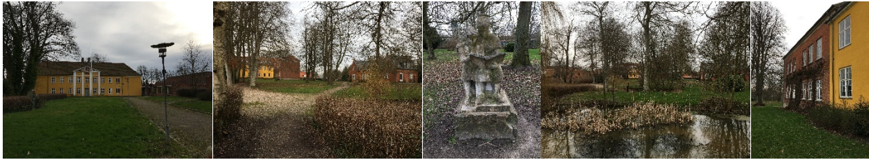
Hovedbygning og tidligere rektorbolig i parken, skulptur, sø i parken, bygningsdetalje.