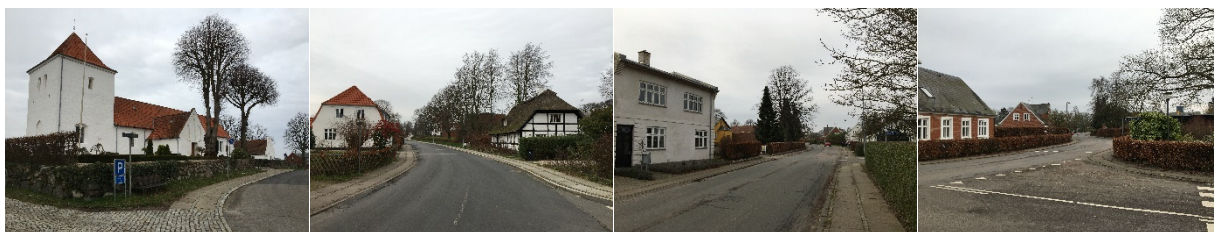
Kirke, Vestergade, Østergade, Stationsbygninger i Østergade.

Nord for hovedbygningen ligger kirken, der understreger seminariets betydning for byens udvikling og de kulturhistoriske bevaringsværdier med udgangspunkt i det præstegårdsseminarie, som det oprindeligt blev opført som. Øst for seminariet ud til Østergade ligger en række stationsbyhuse. Hele seminarieområdet er omkranset af bebyggelse i 1-1½ plan hovedsageligt enfamiliehuse med have omkring.