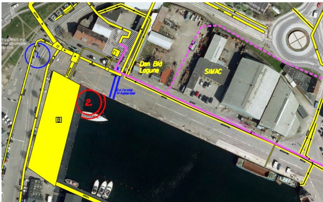
Skitsen viser de to placeringer af den ny pumpestation, samt en evt. mulig placering af Kopperbækkens udløb.

COWI har udarbejdet en detaljeret teknisk vurdering af de to scenarier for pumpestationen (se bilag 1, som giver et godt indtryk af detaljeringsgraden.) COWI udarbejdet en 3D model som giver et meget sikkert billede af teknikken og dermed også en mere sikker vurdering af omkostningerne for de to scenarier. COWI's økonomiske overslag viser at der ligger en besparelse på ca. 10,7 mio. i en placering som vist i scenarie 2, frem for scenarie 1. Den største besparelse ligger i omlægningen af de eksisterende ledninger og bygværker i scenarie 1, en omlægning som ikke vil blive nær så omfattende i scenarie 2. Desuden vil vi i scenarie 1 skulle forstærke kajkanten langs med VA's eksisterende bassin. Denne forstærkning vil i stort omfang ske ved en placering af pumpestationen op af havnekajen, og dermed opnås der endnu en besparelse ved scenarie 2 frem for scenarie 1.