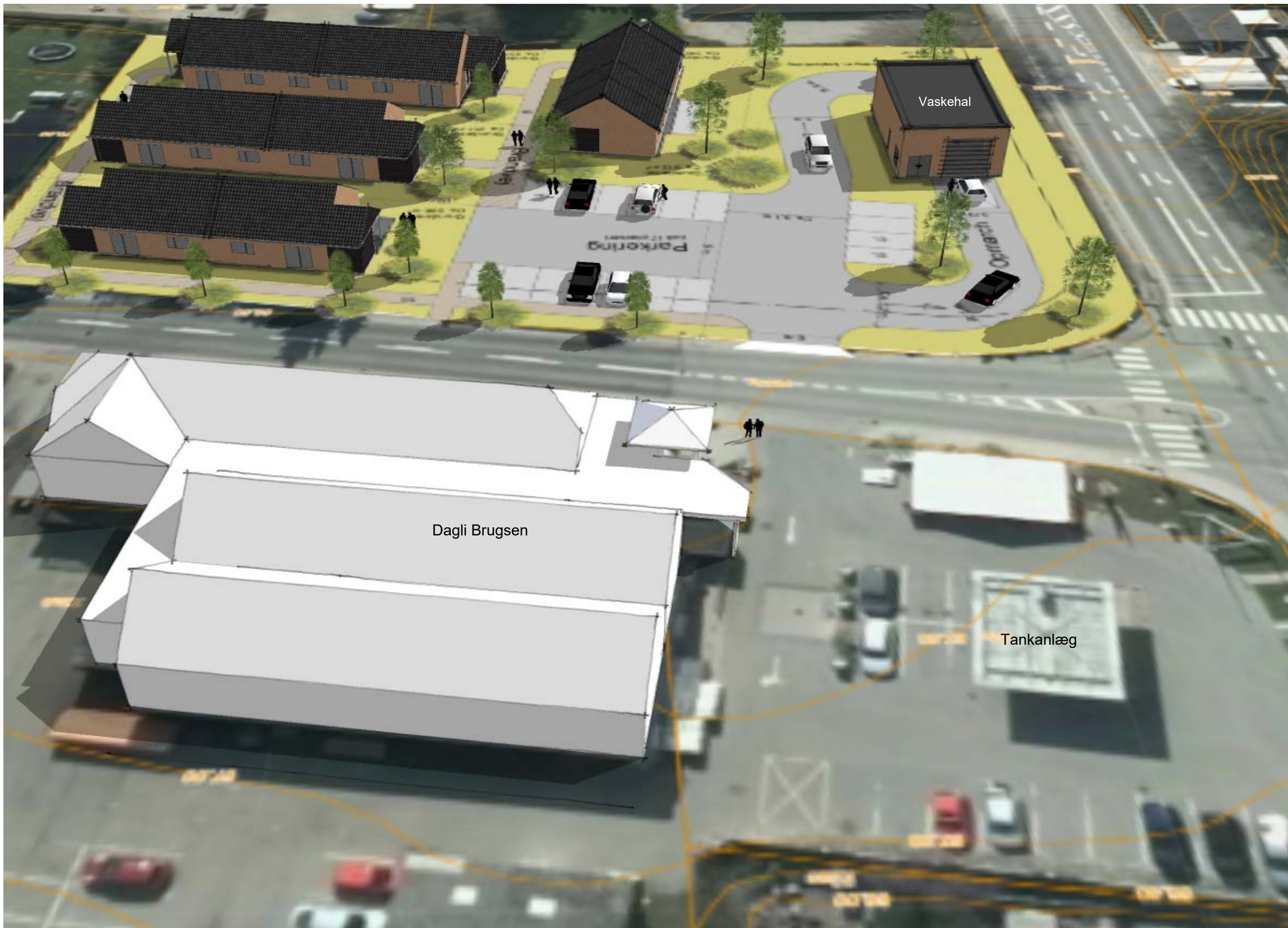
Boliger set i fugleperspektiv fra Nord