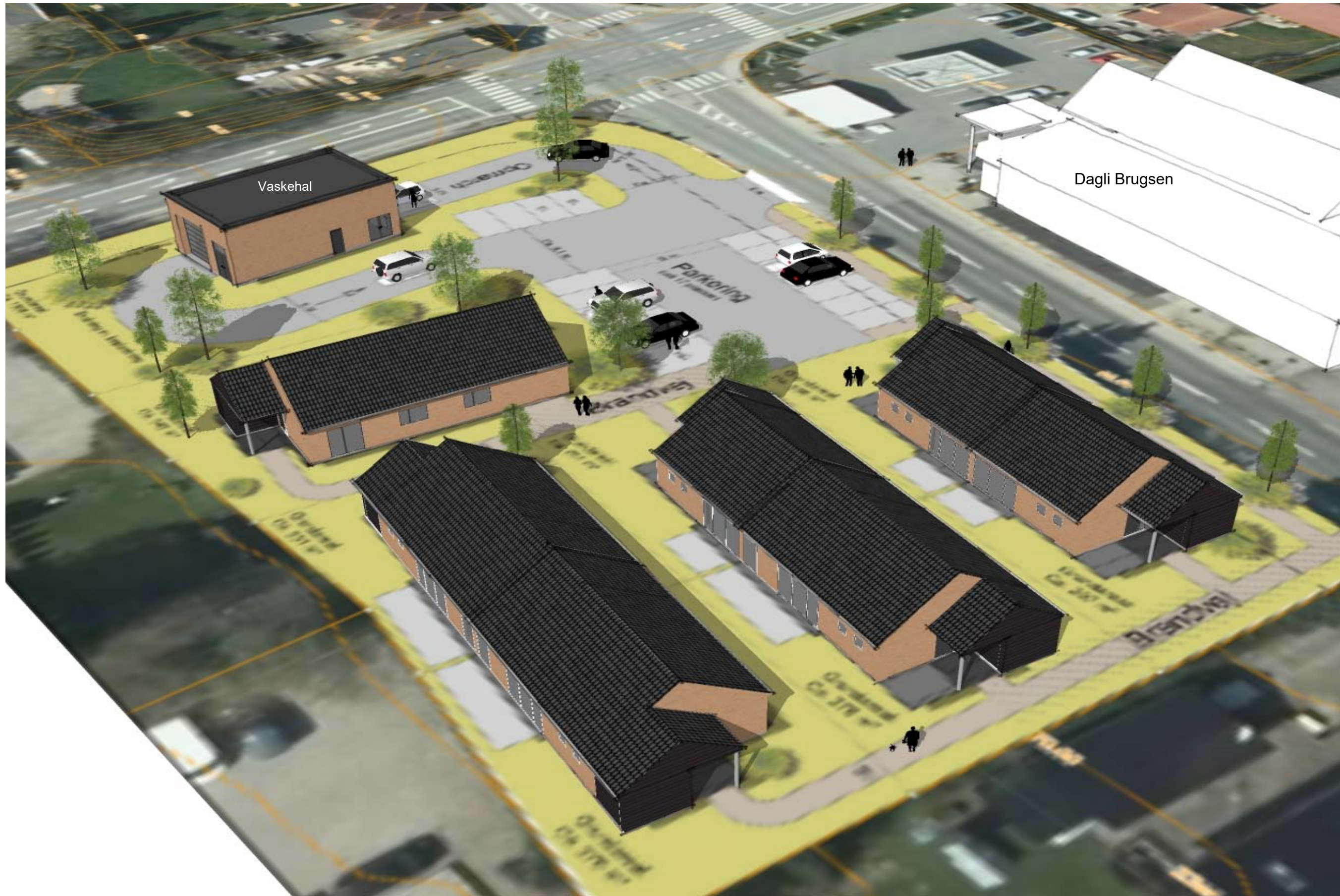
Boliger set i fugleperspektiv fra Sydøst