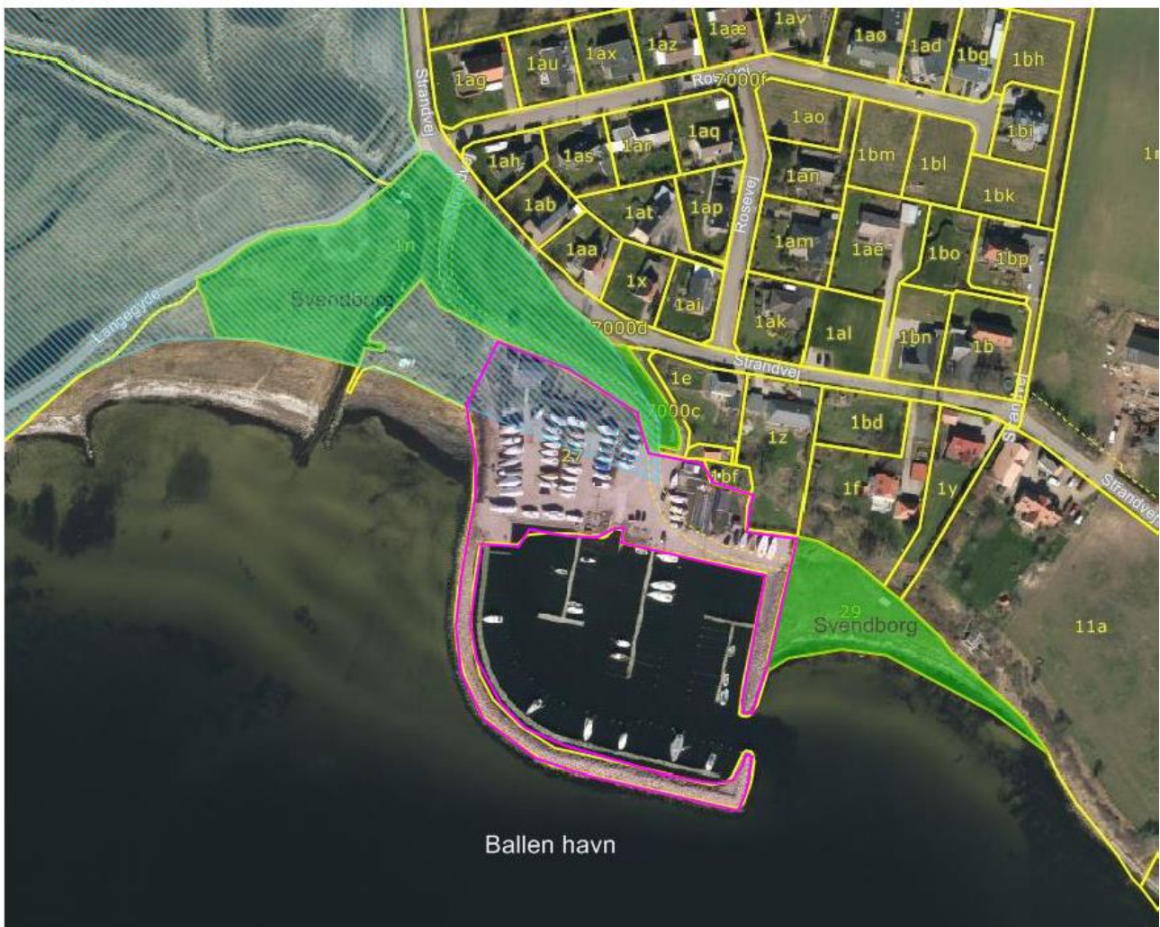
Figur 1. Kortudsnittet viser Svendborg Kommunes forslag til ændring/ophævelse af strandbeskyttelseslinjen ved Ballen Havn. Arealet, hvor strandbeskyttelseslinjen foreslås ophævet, er markeret med lilla omrids.

Svendborg Kommune har ansøgt om ophævelse af strandbeskyttelseslinjen på et areal på og ved Ballen Havn, se figur 1.