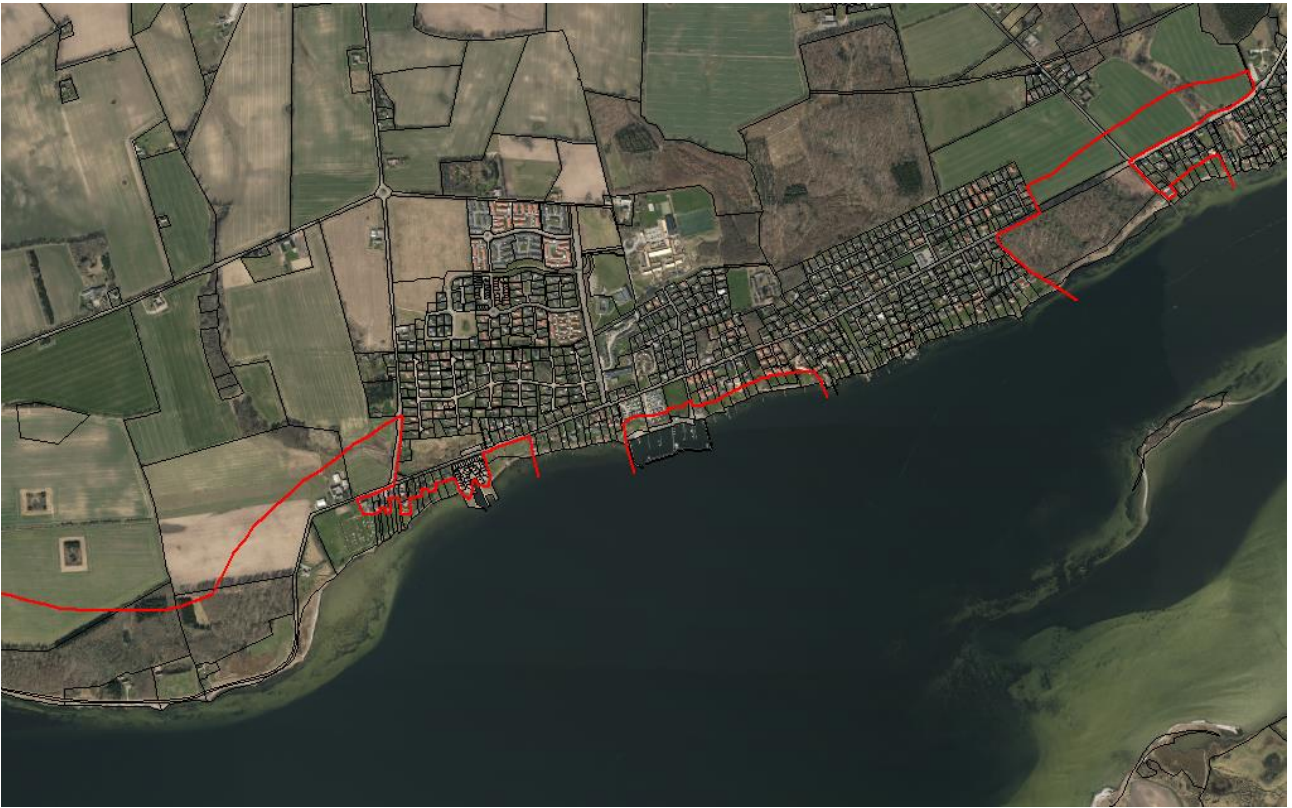
Figur 2. Luffoto 2017 viser Rantzausminde Havn med omgivelser midt i billedet. Strandbeskyttelseslinjen er markeret med rød.

De ansøgte arealer er ikke omfattet af naturfredning efter naturbeskyttelseslovens kapitel 6.