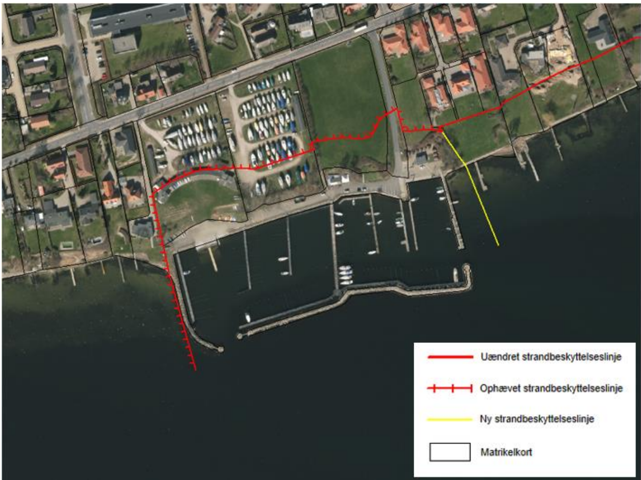
Figur 3. Kortudsnittet viser det nye forløb af strandbeskyttelseslinjen ved Rantzausminde Havn som fastlagt af Kystdirektoratet.