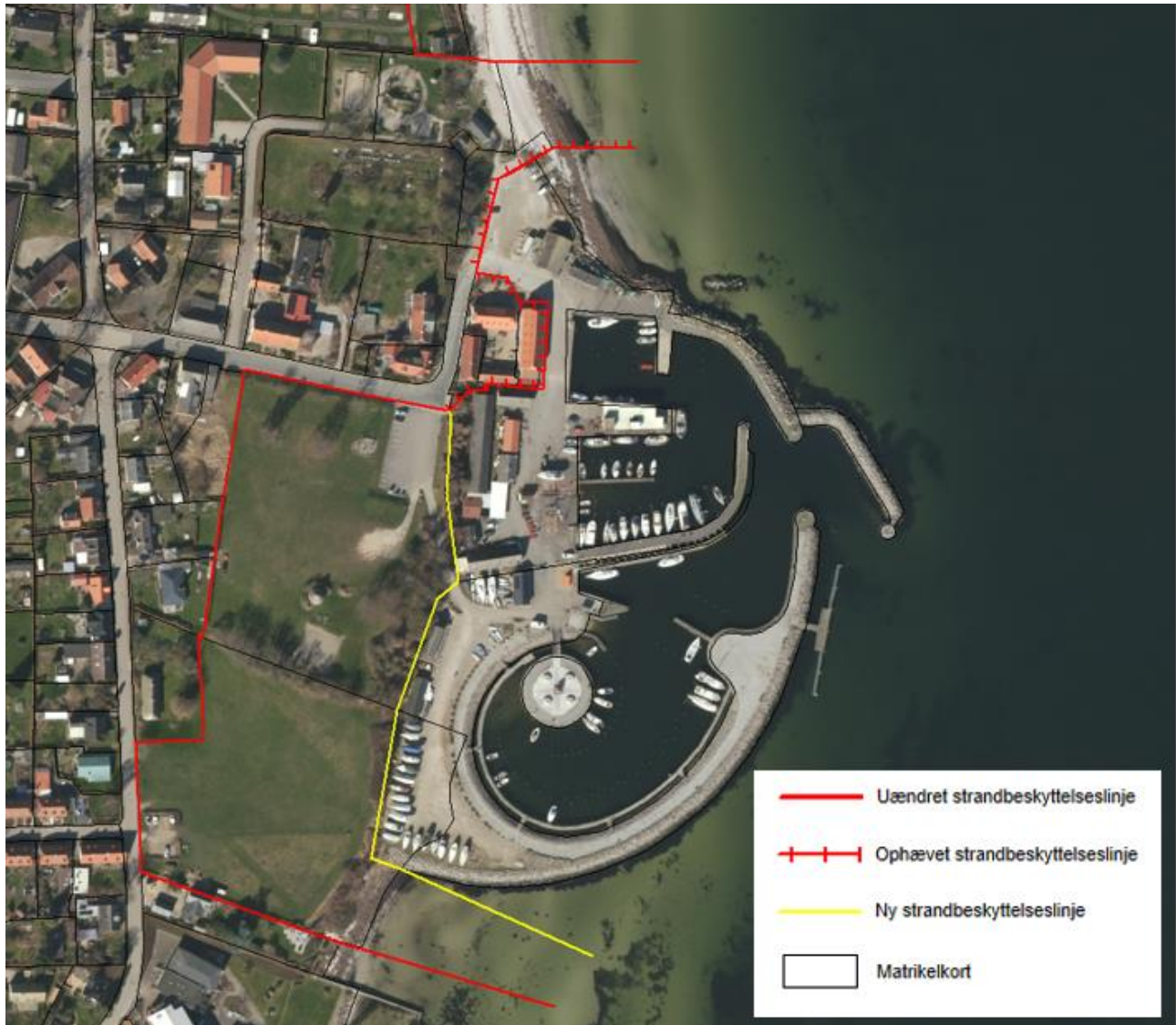
Figur 3. Kortudsnittet viser det nye forløb af strandbeskyttelseslinjen ved Lundeberg Havn som fastlagt af Kystdirektoratet.

På baggrund af afgørelsen vil Kystdirektoratet ændre strandbeskyttelseslinjens forløb, som det fremgår af kortet i figur 3.