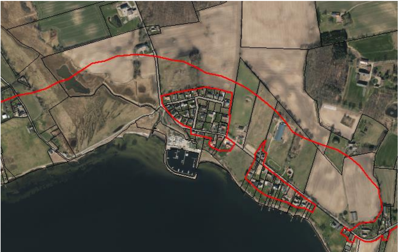
Figur 2. Luffoto 2017 viser Ballen Havn med midt i billedet. Strandbeskyttelseslinjen er markeret med rød.

Havnen ligger i den vestlige del af Ballen, hvis bymæssige bebyggelse ligger langs Strandvejen med flere samlede bebyggelser. Se figur 2.