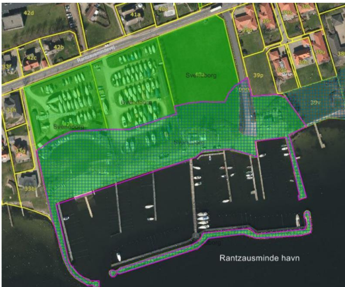
Figur 1. Kortudsnittet viser Svendborg Kommunes forslag til ændring/ophævelse af strandbeskyttelseslinjen ved Rantzausminde Havn. Aarealet, hvor strandbeskyttelseslinjen foreslås ophævet, er markeret med lilla omrids.

Svendborg Kommune har ansøgt om ophævelse af strandbeskyttelseslinjen på et areal på og ved Rantzausminde Havn, se figur 1.