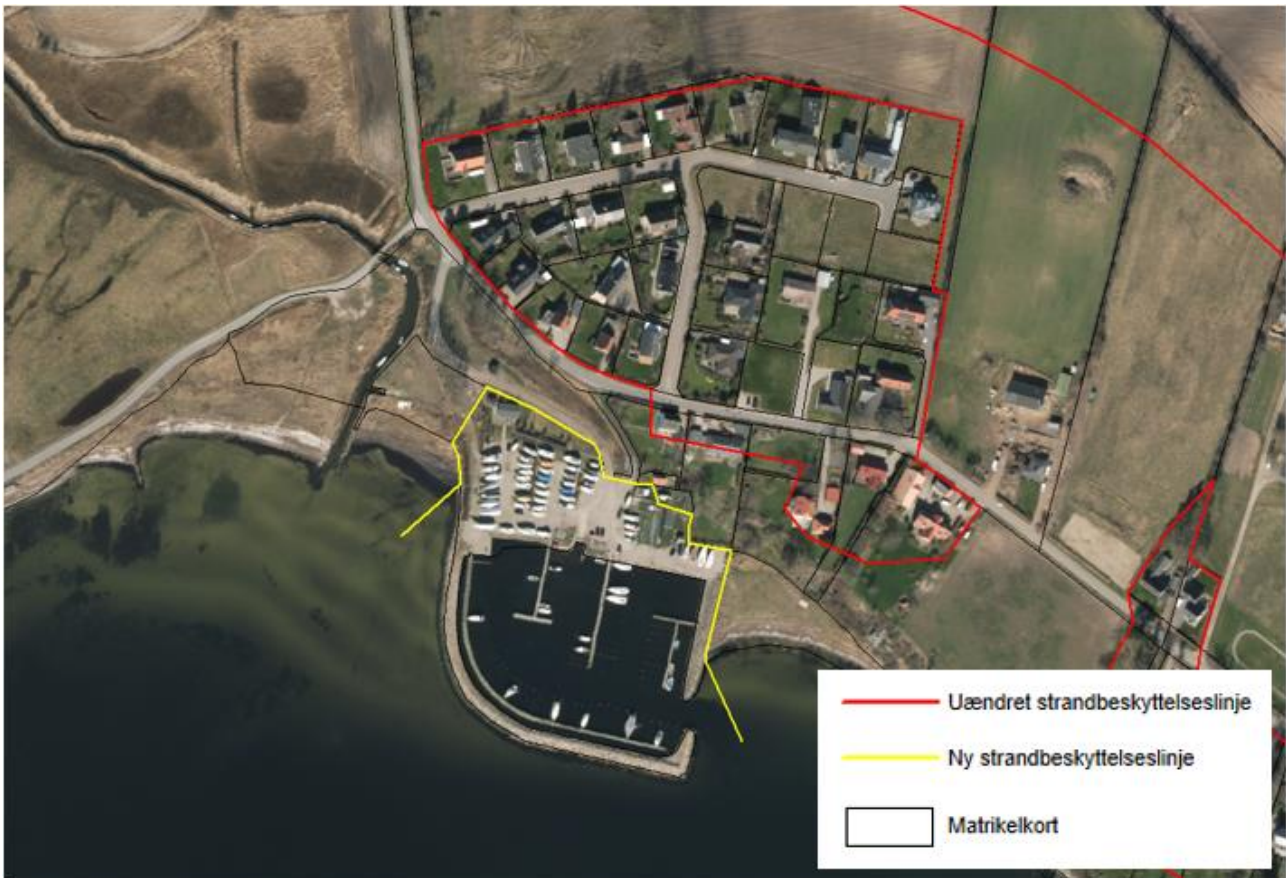
Figur 3. Kortudsnittet viser det nye forløb af strandbeskyttelseslinjen ved Ballen Havn som fastlagt af Kystdirektoratet.