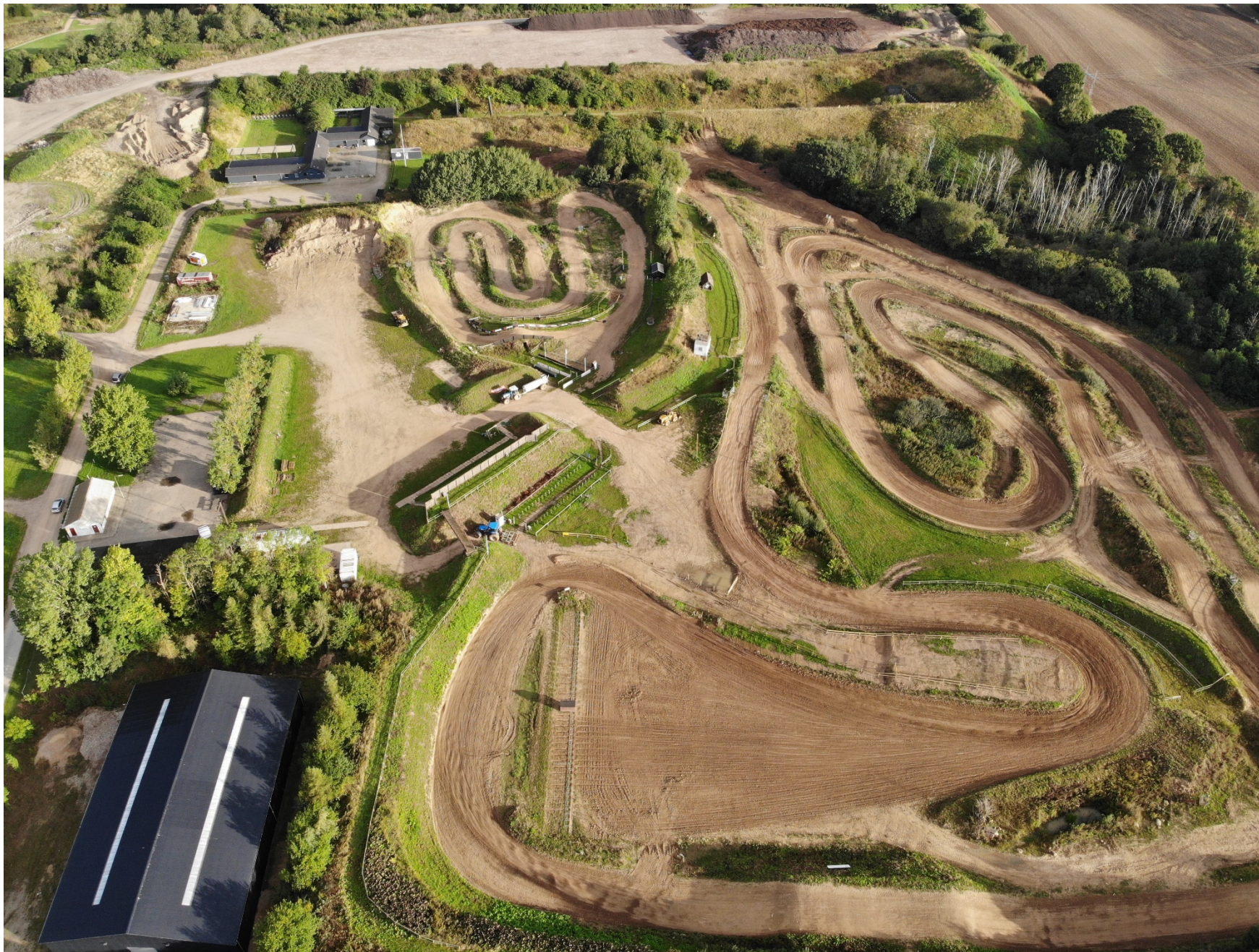
4 Dronebillede der viser motocross baneforløbet (tilsendt af formand Frank Hüttmann 05. september 2019)