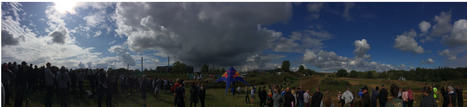
1 Panorama-billede - optaget fra midterste publikums-areal

Det er derfor miljømyndighedens vurdering, at motocrossbanen er arealfølsom anvendelse i forhold til risikobekendtgørelsens særregel om ammoniak.