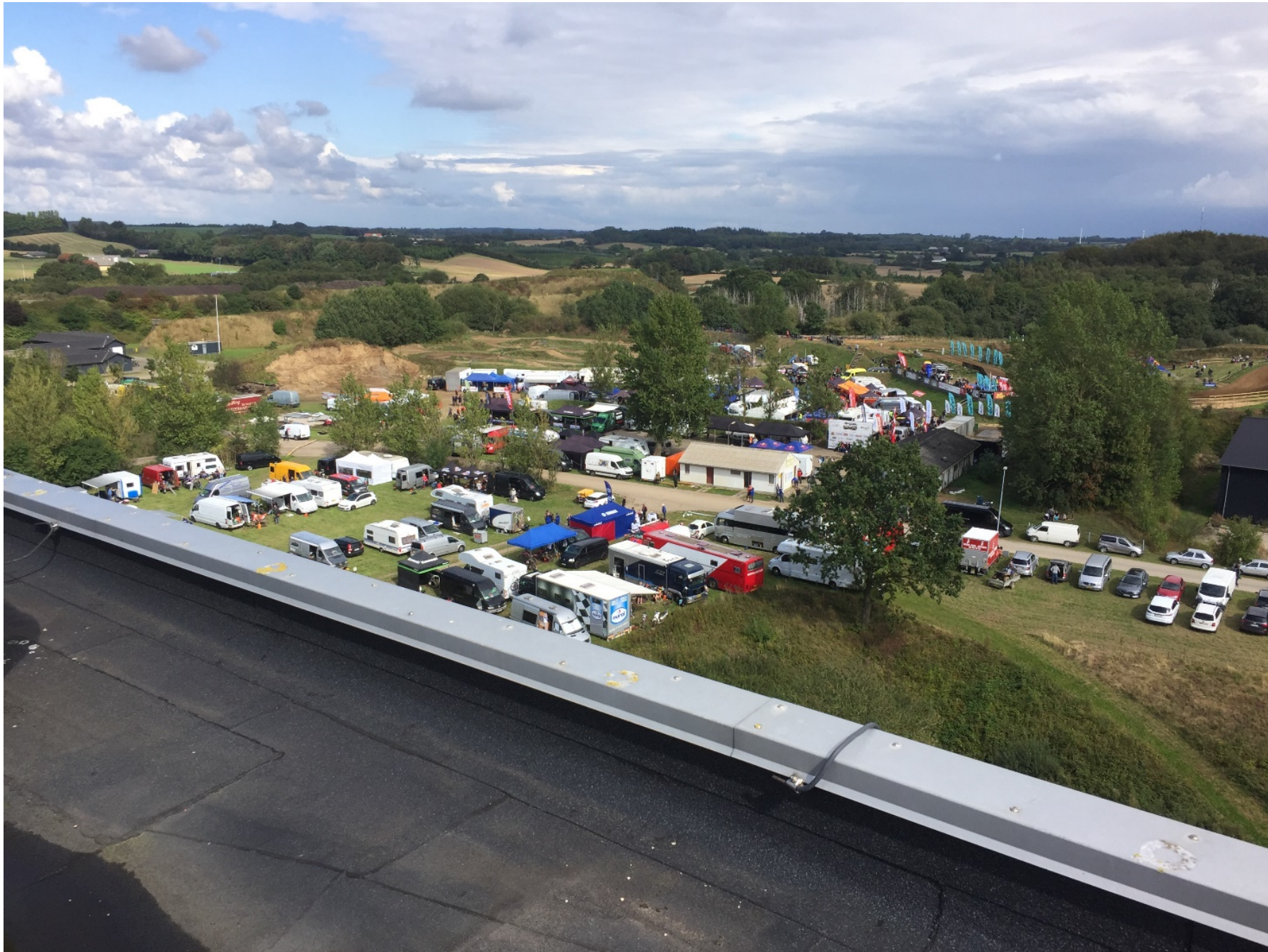
2 Billede af parkerings og toilet samt klubhus - optaget fra Svendborg Kraftvarmes tag