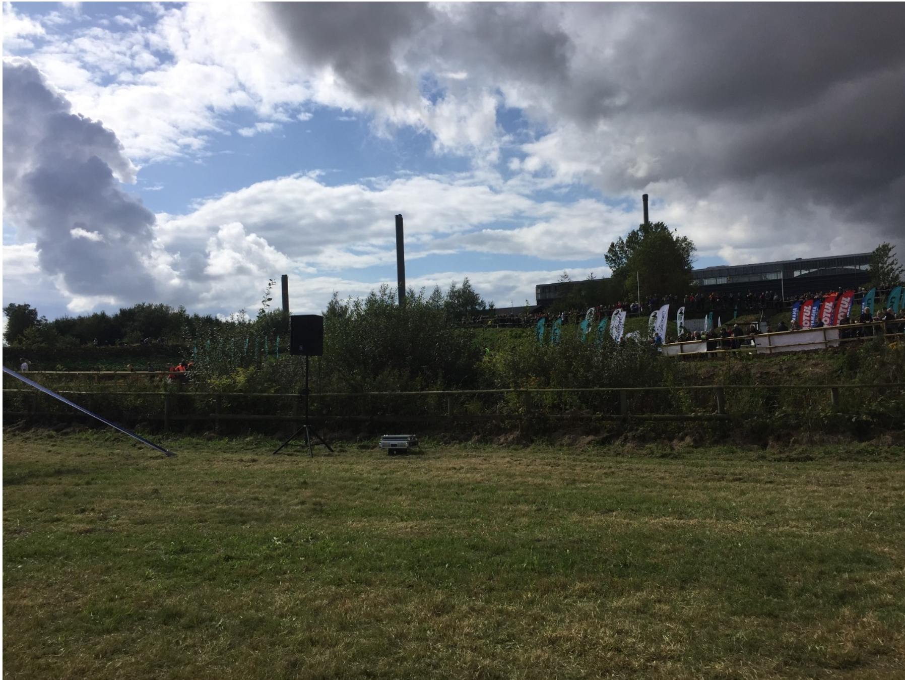
3 Billede af de sydvestlige publikumsarealer – optaget fra midterste publikumsareal