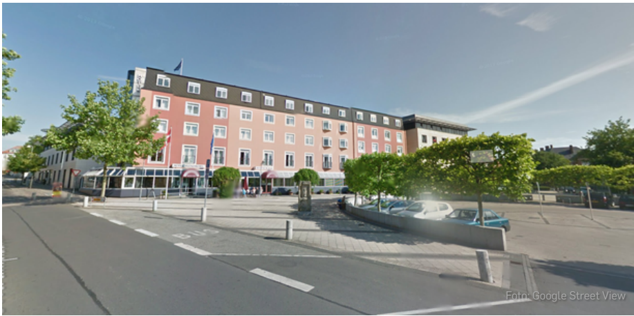
Sådan ser Hotel Svendborg ud i dag.