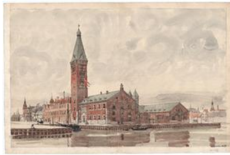
Her ses Hack Kampmanns perspektivtegning af Aalborg Toldkammerbygning, opført 1900-1902.

»Jeg siger ikke, at moderne visualiseringer ikke kan bruges til noget, men når det drejer sig om byrum og proportioner i stor skala, så er der efter min opfattelse ikke noget bedre end den klassiske arkitekturmodel.«