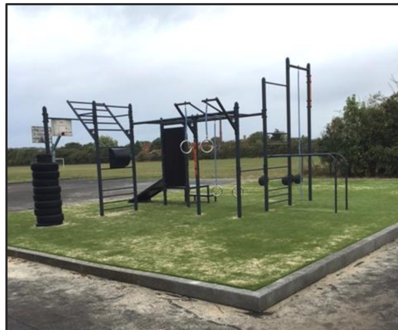
Tressfit på kunstgræs