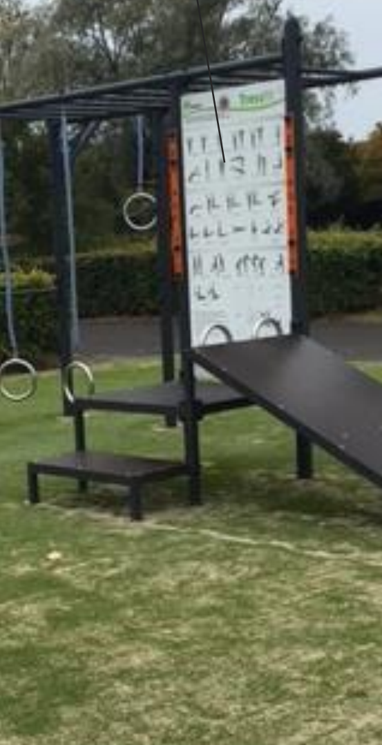
Planche med træningsøvelser