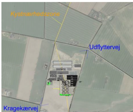
Figur 13 Kragekærvej 12 og placering af kystnærhedszonen (gul linje).

Den vestlige del af planområdet placeres indenfor kystnærhedszonen se den efterfølgende figur.