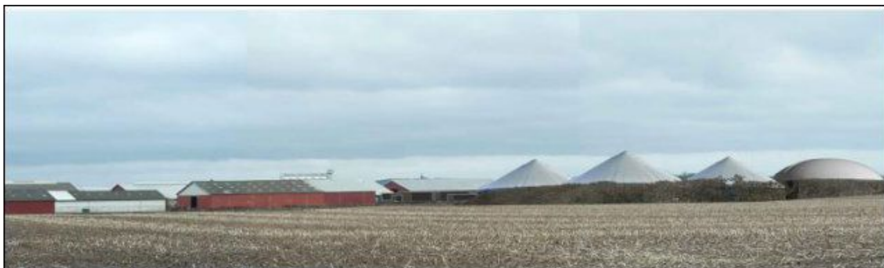
Visualisering 2) Biogasanlæg og husdyrbrug set fra Kragekærvej. På visualiseringen er tankene vist som 14 m høje.