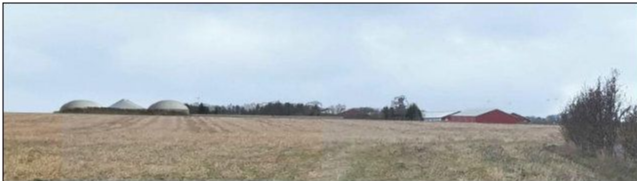
Visualisering 1) Biogasanlæg og husdyrbrug set fra Gesinge.