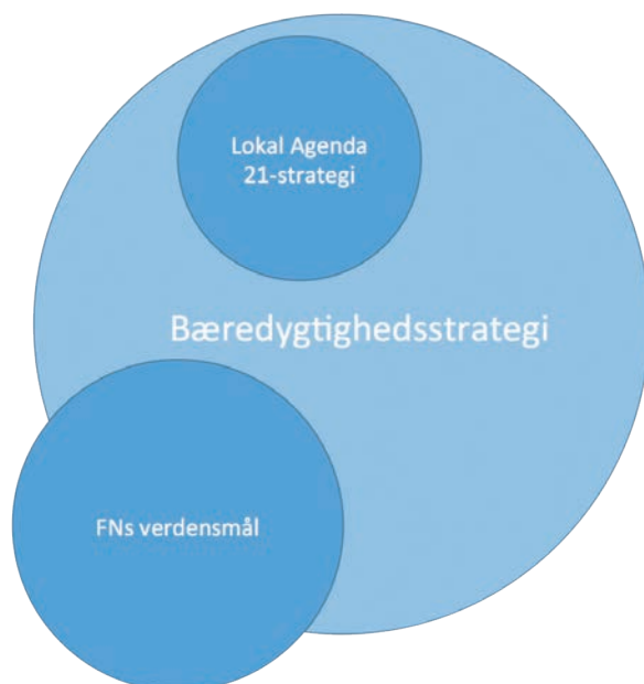
Figur 1: Svendborg Kommunes bæredygtighedsstrategi er vores Lokal Agenda 21-strategi samt vores fokus på udvalgte FN verdensmål.

En Lokal Agenda 21-strategi skal indeholde beskrivelse af, hvordan kommunen vil mindske miljøbelastningen, fremme biologisk mangfoldighed, fremme samspil mellem beslutninger om miljø, økonomi og sociale forhold samt inddrage befolkning og erhvervsliv.