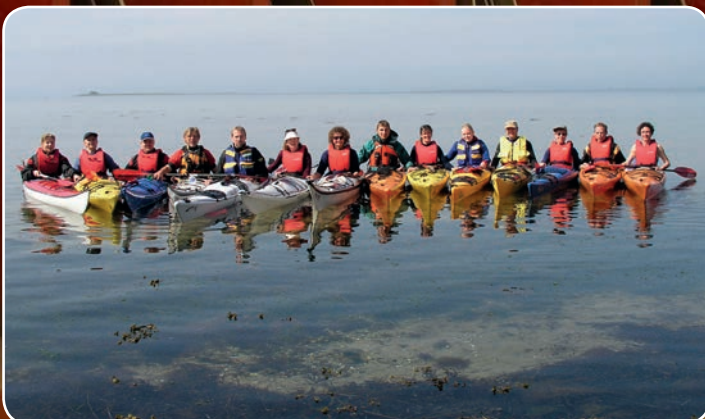
Øhavet tiltrækker turister, blandt andet havkajakroere