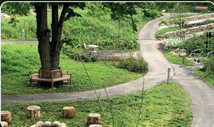
Demensbyens have giver aktivitetsmuligheder og livskvalitet for beboerne.