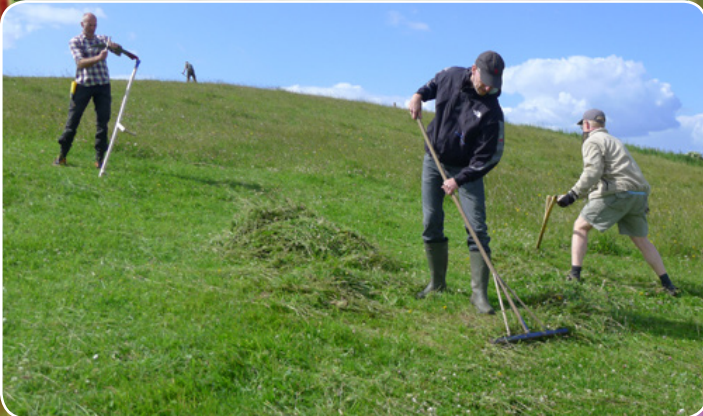
Høstetlaug gavner biodiversiteten.