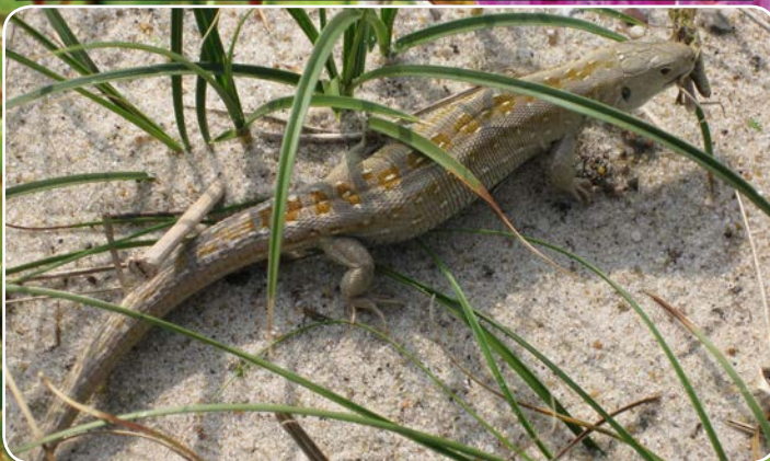
Markfirben stiller særlige krav til levesteder.