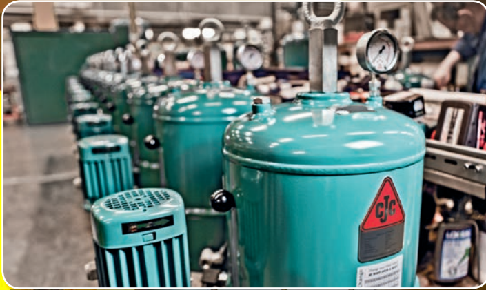
CC Jensen – en lokal virksomhed, der arbejder med cirkulær økonomi indenfor oliefiltreringsløsninger.