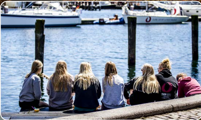
Cittaslow- det gode liv - er også mødet mellem by og havn.