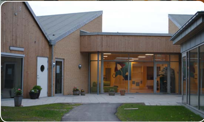
Daginstitutionen Humlebien er DGNB-certificeret.