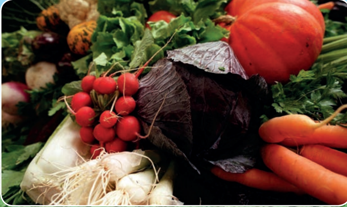
Økologi og årstidens lokale råvarer er i fokus.