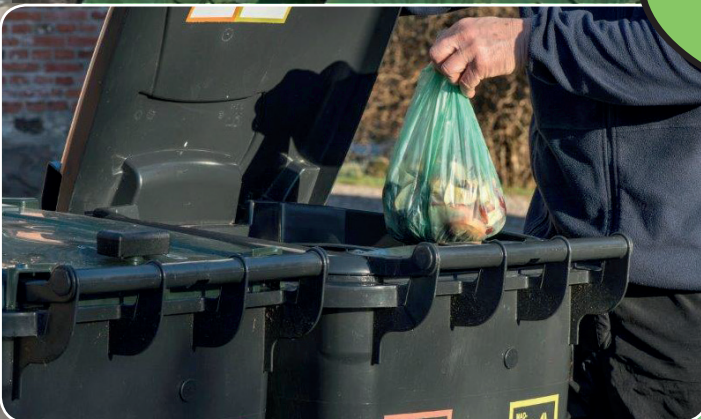
Mere affaldssortering bliver en realitet i 2020.