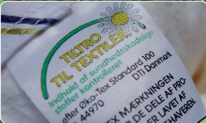
Miljøcertifikater sikrer et mere miljøvenligt valg.