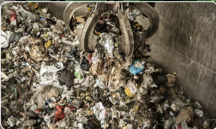
Restaffaldet afbrændes hos Svendborg Kraftvarme og bliver til varme for Svendborg Fjernvarmes kunder.

"Efterspørg lokale økologiske produkter. Det kan skabe arbejdspladser." Input fra borgermøde