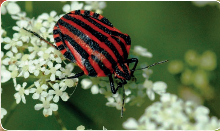
Stribetæge - et smukt insekt, der lever i naturvenlige haver.