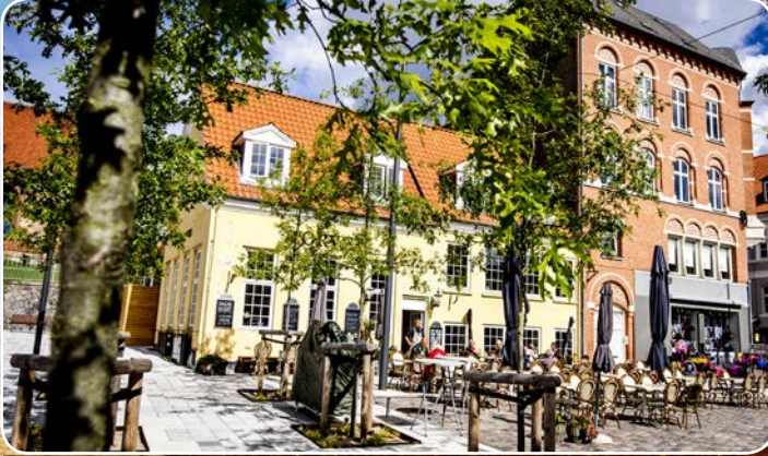
Træer i byrummet skaber oplevelser og stemning i byen.