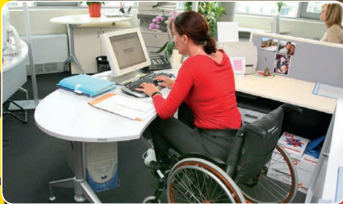
Flere handicappede skal i arbejde