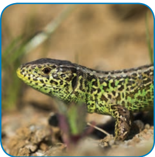
Markfirbenet lever på solrige sandede skrænter få steder i kommunen.