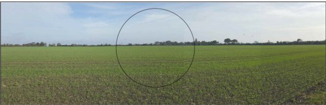
Visualisering 6) Biogasanlæg og husdyrbrug set fra nordvest ved Vejlen. Bebyggelsen ligger inden for cirklen, men bag den beplantning der ses i horisonten.