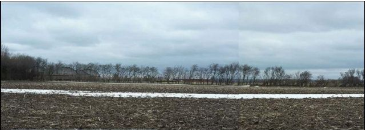
Visualisering 3) Biogasanlæg og husdyrbrug set fra Skovballevej. Bebyggelsen er delvist skjult bag eksisterende levende hegn samt det levende hegn kommuneplantillæg og lokalplan sikrer.