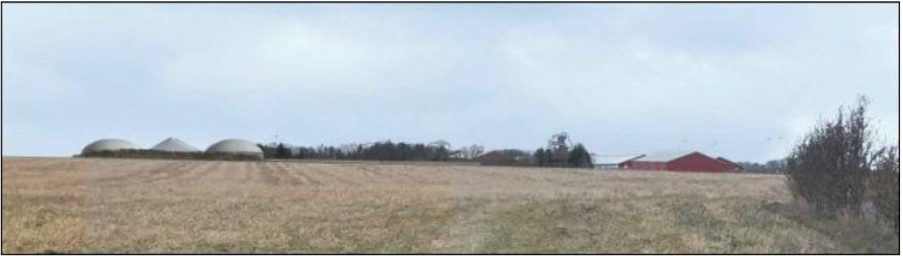
Visualisering 1) Biogasanlæg og husdyrbrug set fra Gesinge.