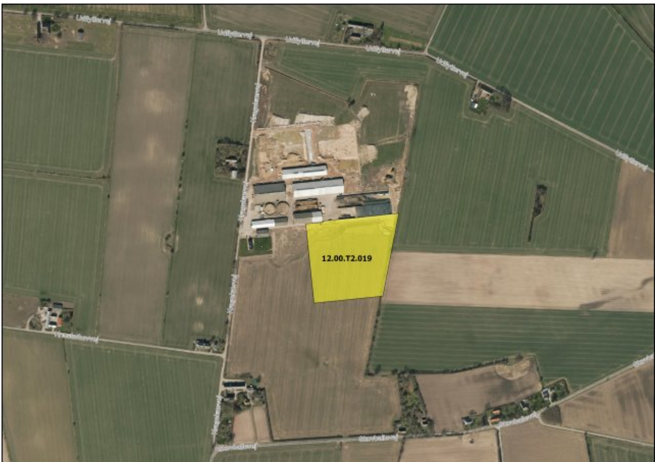
Kommuneplantillægget dækker et areal på ca. 3,3 ha. Afgrænsningen af det nye rammeområde 12.09.T2.019

For at kunne realisere etablering af biogasanlægget skal der tilvejebringes det nødvendige plangrundlag i form af et kommuneplantillæg og en lokalplan. Kommuneplantillægget og tilhørende lokalplan omfatter kun areal til selve biogasanlægget og ikke husdyrbedriften.