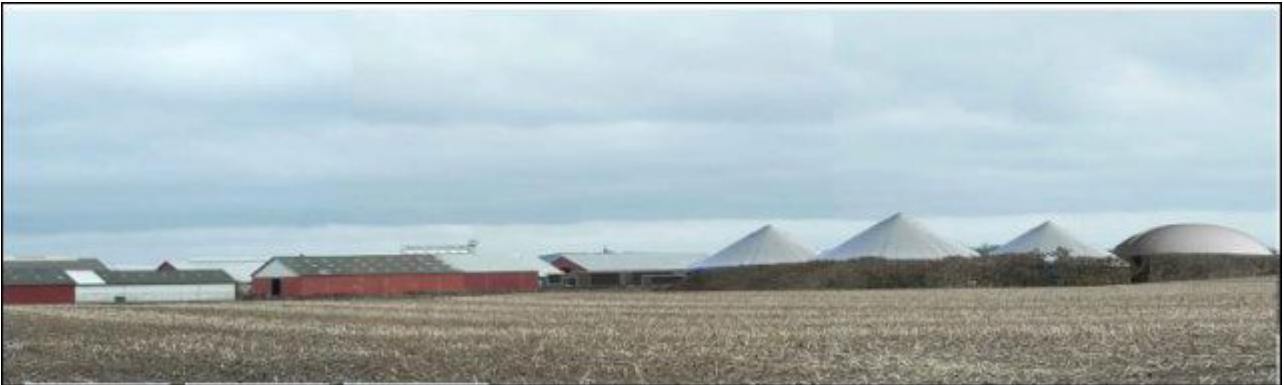
Visualisering 2) Biogasanlæg og husdyrbrug set fra Kragekærvej. På visualiseringen er tankene vist som 14 m høje.