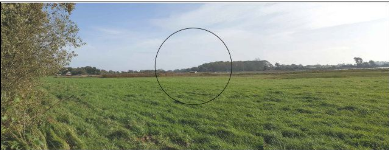
Visualisering 5) Biogasanlæg og husdyrbrug set fra vest. Bebyggelsen ligger inden for cirklen, men bag den beplantning der ses i horisonten.