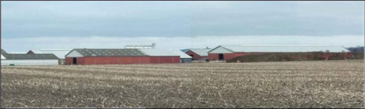
Visualisering 4) Set fra Udflyttervej. Biogasanlægget ses ikke, da det ligger skjult bag bygningerne fra selve husdyrbruget.