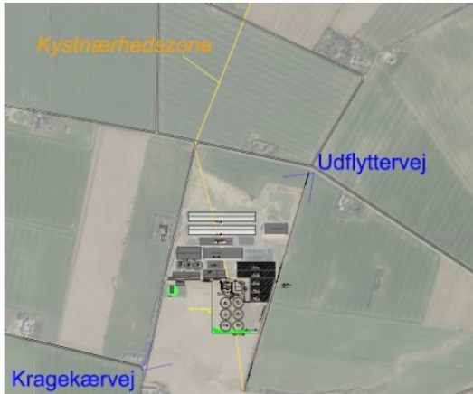
Figur 13 Kragekærvej 12 og placering af kystnærhedszonen (gul linje).

Den vestlige del af planområdet placeres indenfor kystnærhedszonen se den efterfølgende figur.