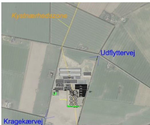
Figur 13 Kragekærvej 12 og placering af kystnærhedszonen (gul linje).

Den vestlige del af planområdet placeres indenfor kystnærhedszonen se den efterfølgende figur.