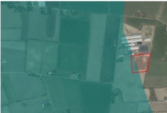
En mindre del af lokalplanområdet ligger i den 2 km brede kystnærhedszone.

Der er gennemført en visualisering fra kysten jf. bilag 19. Det fremgår af denne visualisering, at biogasanlægget pga. landskabets udformning, terræn, eksisterende hegn mv. ikke er synligt fra kysten.