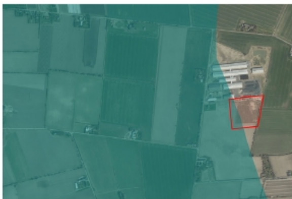
En mindre del af lokalplanområdet ligger i den 2 km brede kystnærhedszone.

Der er gennemført en visualisering fra kysten jf. bilag 19. Det fremgår af denne visualisering, at biogasanlægget pga. landskabets udformning, terræn, eksisterende hegn mv. ikke er synligt fra kysten.