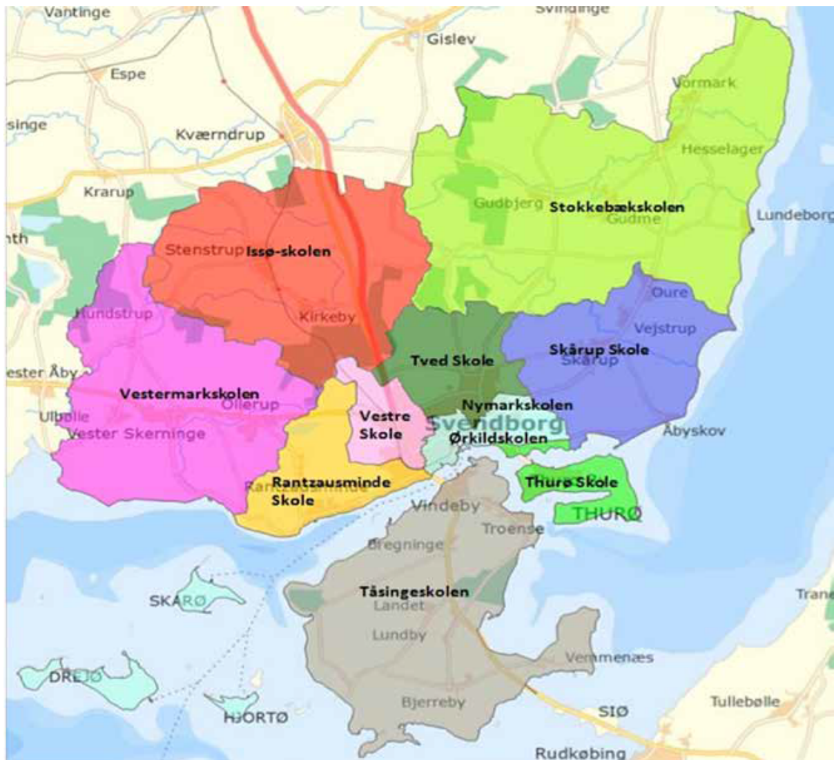
Kort over skoledistrikter