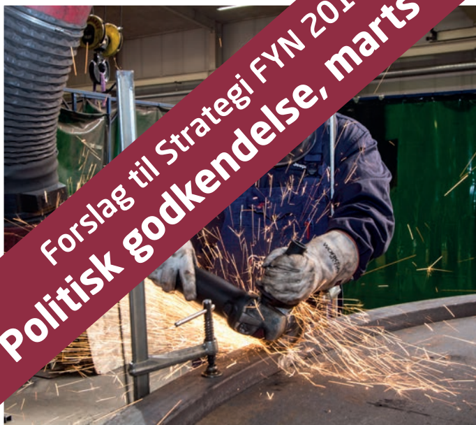
Arbejdsmarked & Uddannelse

Forslag til Strategi FYN 2018-21 Politisk godkendelse, marts 2018