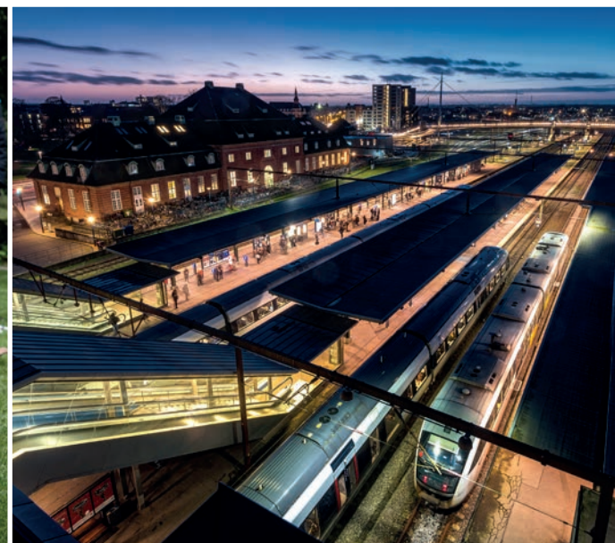
Infrastruktur & Mobilitet