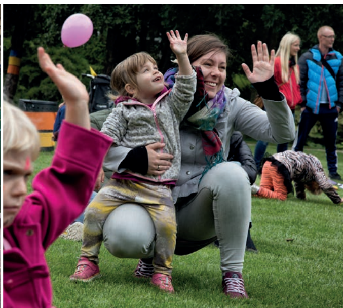
Bosætning & Attraktivitet